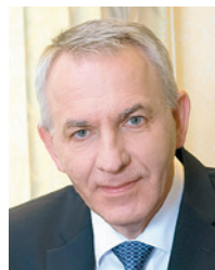
Академик РАН Е.В. Шляхто