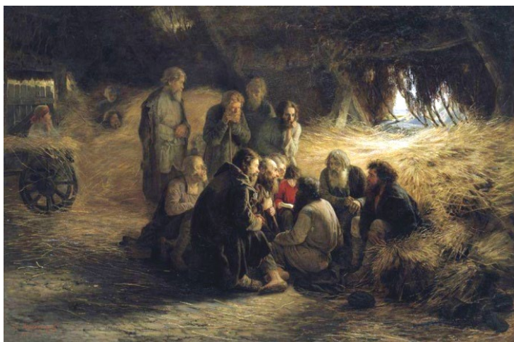
Мясоедов Г.Г. Чтение Положения 19 февраля 1861 г.

Восторженность, с которой был встречен выход Манифеста, вскоре сменилась разочарованием. Бывшие крепостные ожидали полной воли и были недовольны переходным состоянием "временнообязанных". Полагая, что от них скрывают истинное значение реформы, крестьяне бунтовали, требуя освобождения с землёй. Для подавления наиболее крупных выступлений, сопровождавшихся захватом власти, как в сёлах Бездна (Казанская губерния) и Кандеевка (Пензенская губерния), были использованы войска. Всего было зафиксировано более двух тысяч выступлений. Однако к лету 1861 года волнения пошли на убыль.