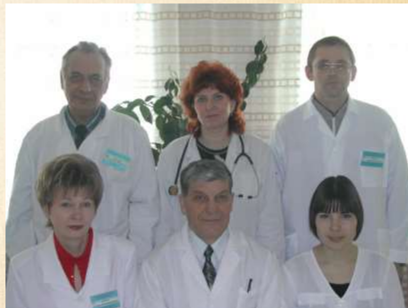
Коллектив кафедры, 2003 г.