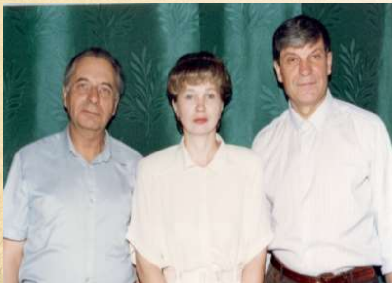
Коллектив кафедры, 1998 г.