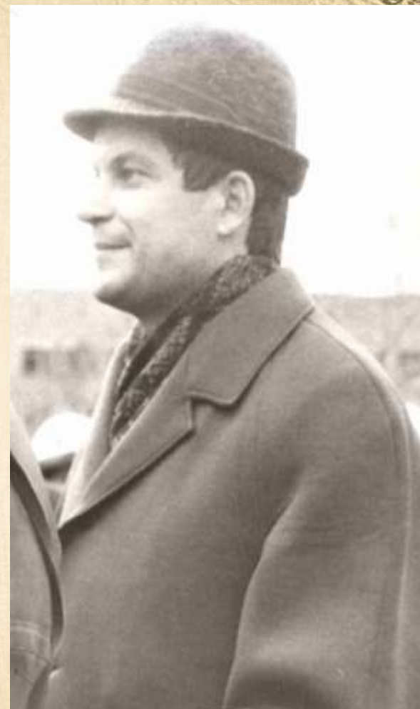
Демонстрация, 1 мая 1974 г.