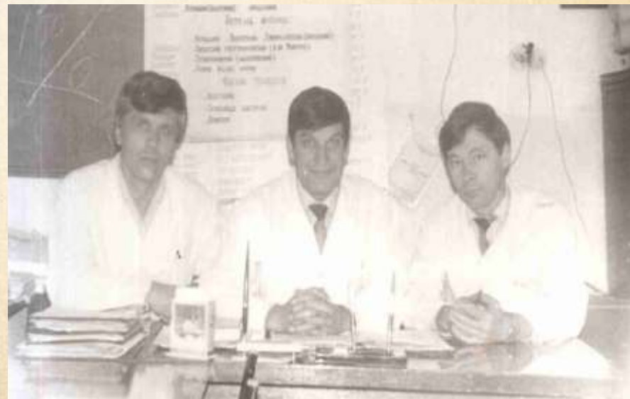
С ассистентами на кафедре, 1980 г.