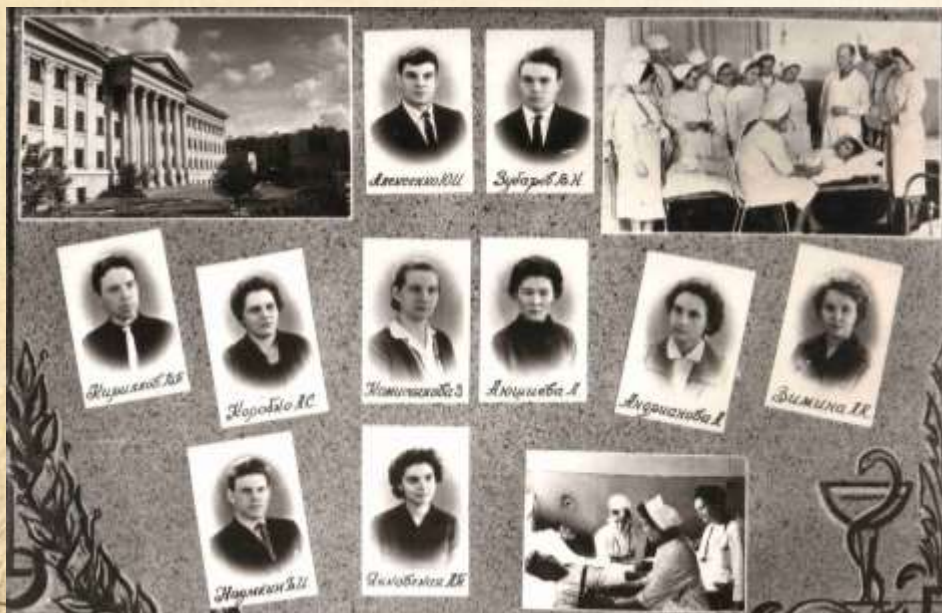
5 выпуск ЧГМИ, 1957-1963 гг.