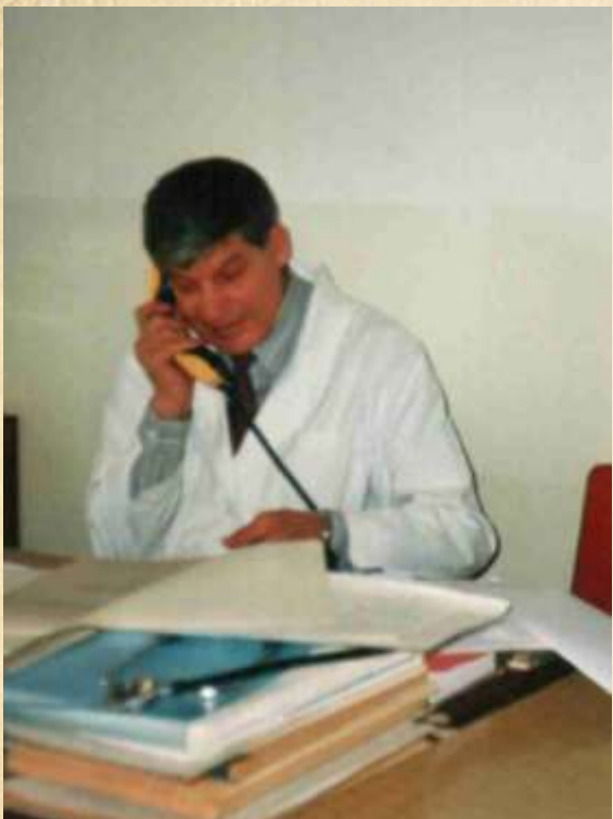
За работой на кафедре, 1991 г.