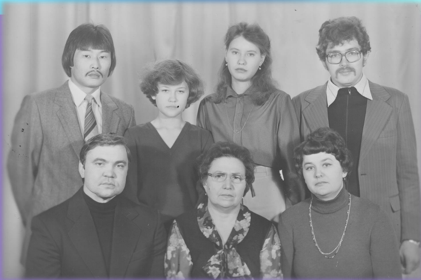
Коллектив кафедры 1986 год.