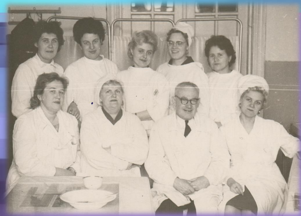
Сотрудники кафедры 1967 г.