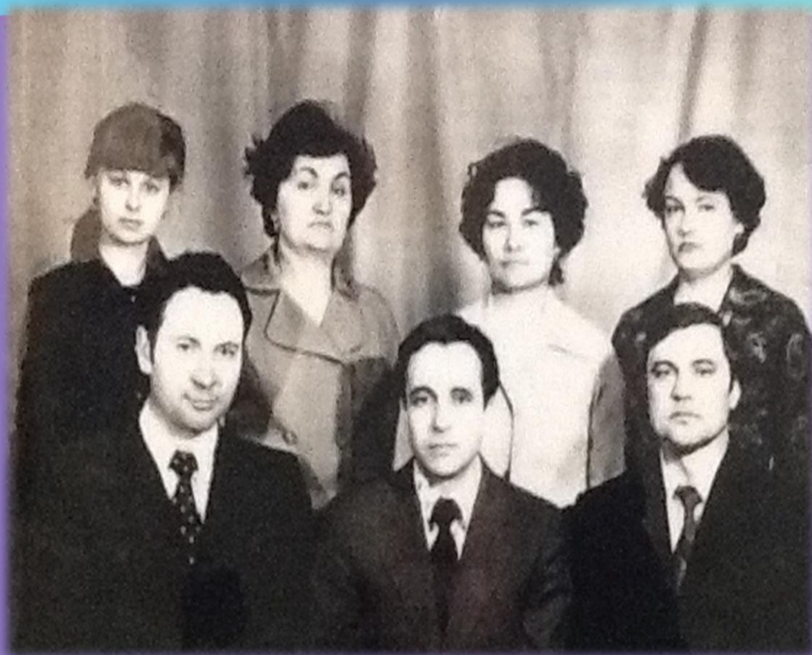
Коллектив кафедры 1980 год.