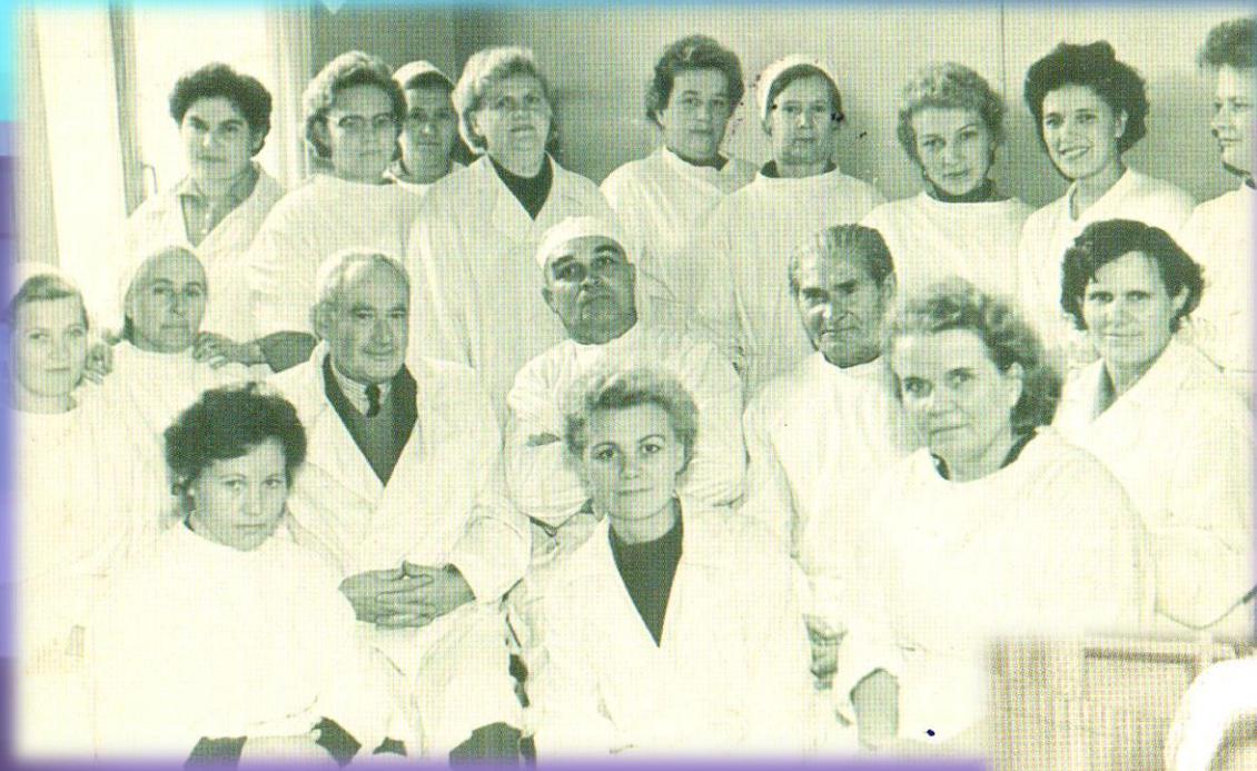
Коллектив стационара и кафедры кожных и венерических болезней 23 сентября 1964