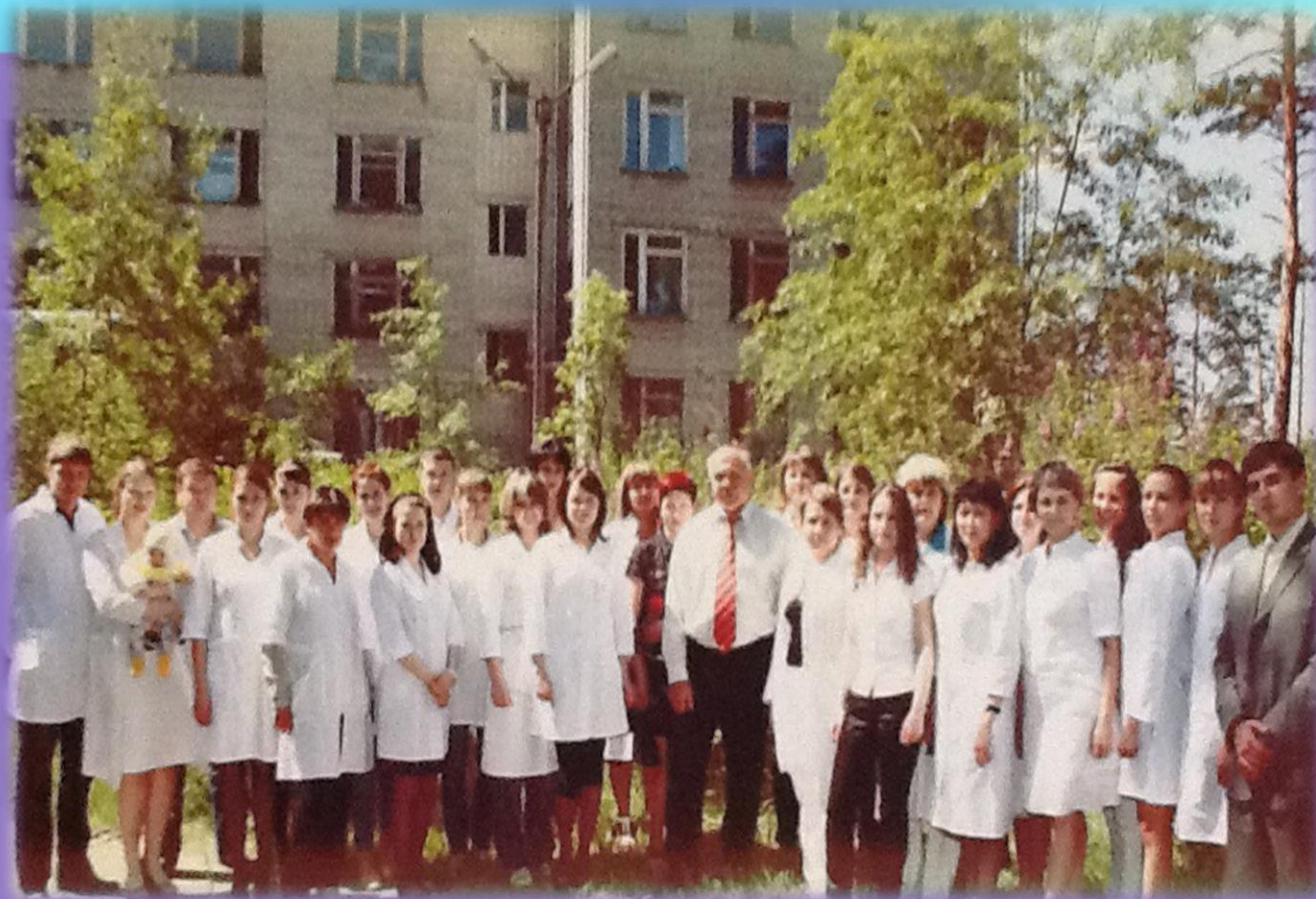
Краевой кожно-венерологический диспансер. Июнь 2009 г.