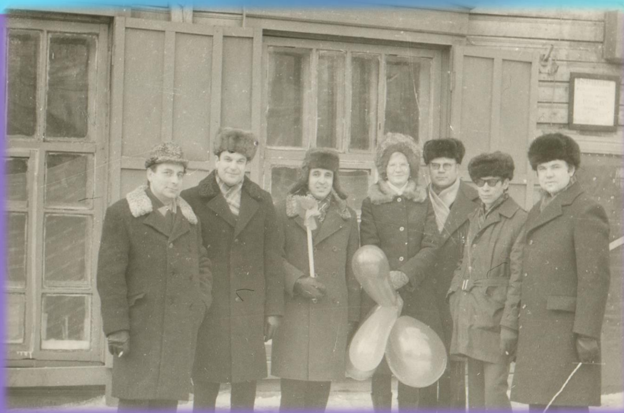
Сотрудники кафедры с коллегами 7 ноября 1978 г.