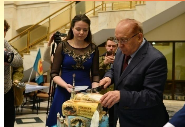
Студенческий огонёк с ректором в библиотеке МГУ