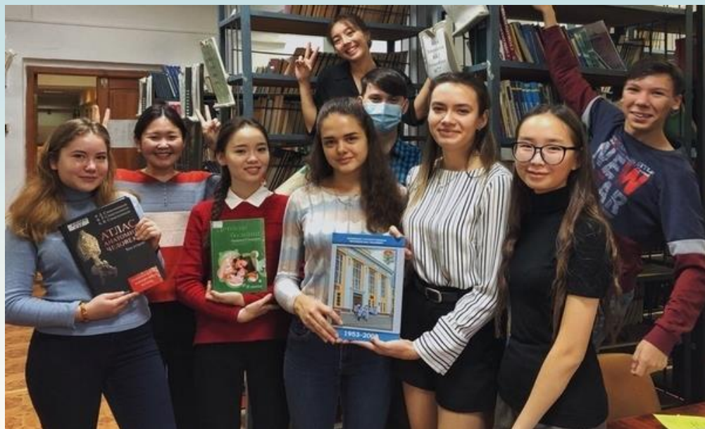
Библиоквест в библиотеке