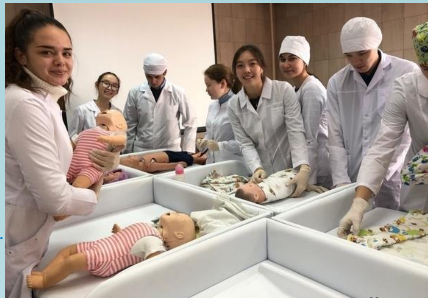
Пеленаем кукольных малышей

246 группа педиатрического факультета предоставляет фотографии студенческих будней. Здесь вы можете увидеть кафедры нашей академии, нашу практику, тренировки в общежитии, разминку после пары по анатомии, фотографию с посвящения в первокурсники и т.д.