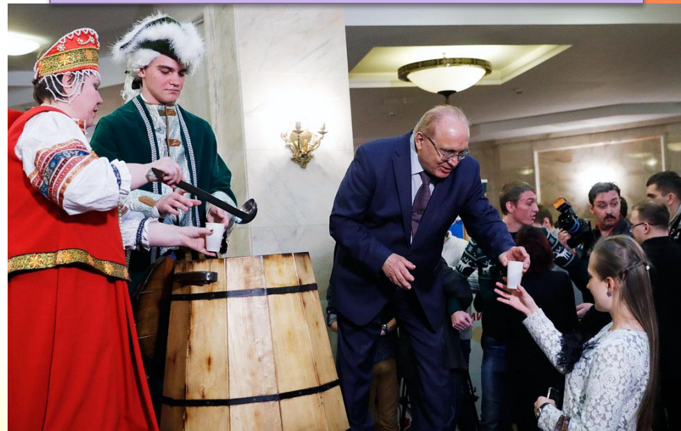
Виктор Садовниченко – академик РАН, ректор МГУ, угощает студентов медовухой