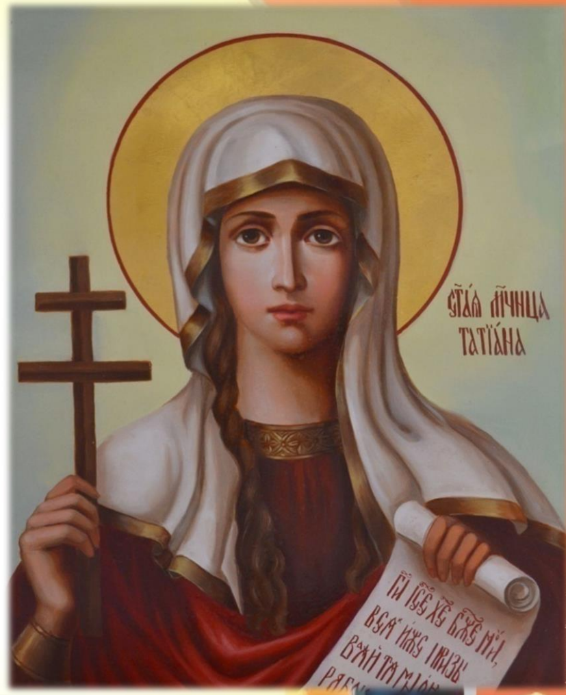
Святая великомученица Татьяна, покровительница студентов

Святая великомученица Татьяна стала считаться покровительницей Московского университета. В честь святой Татьяны в 1837 года при университете была открыта церковь во флигеле дома Пашкова . Изначально, Татьянин день в качестве студенческого праздника имел характер торжества, которое отмечалось только в столице. Начинаясь праздник молебном в церкви, после которого все отправлялись на торжественное собрание, где выступал ректор и вручались награды лучшим студентам. После собрания следовал банкет, а затем гуляния, в которых принимали участие, как студенты, так и преподаватели.