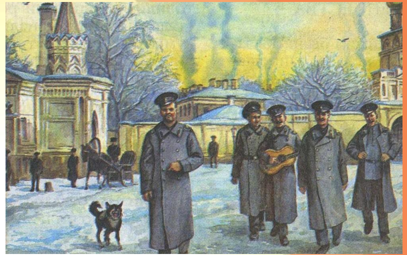
Студенческие гулянья на Тверском бульваре

Во время студенческих застолий можно было даже произносить такие речи, которые больше нигде нельзя было повторить. И все это в атмосфере свободы и безнаказанности.