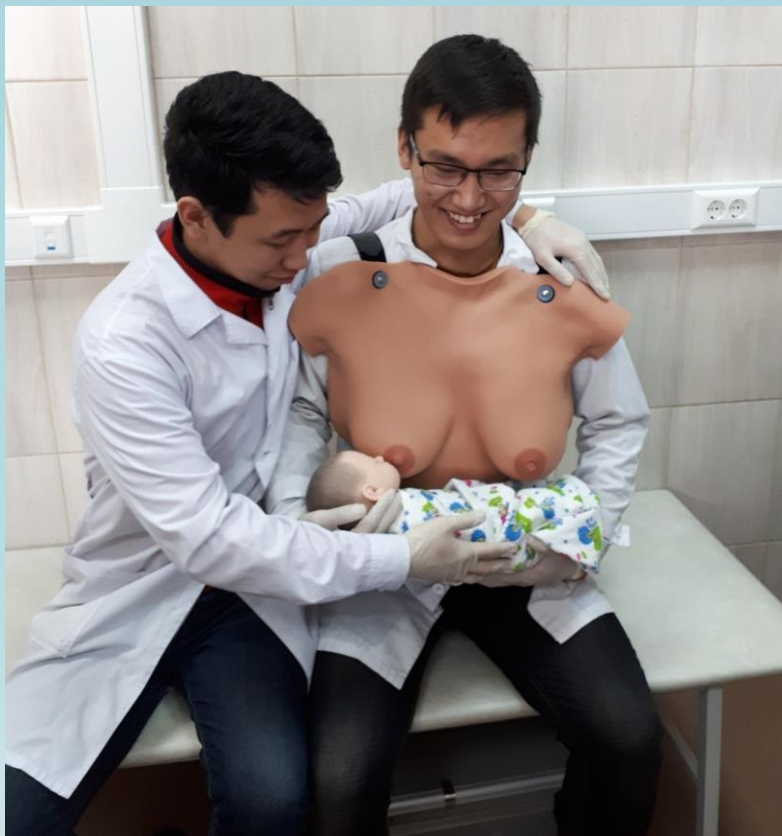
Крутым парням всё по плечу!