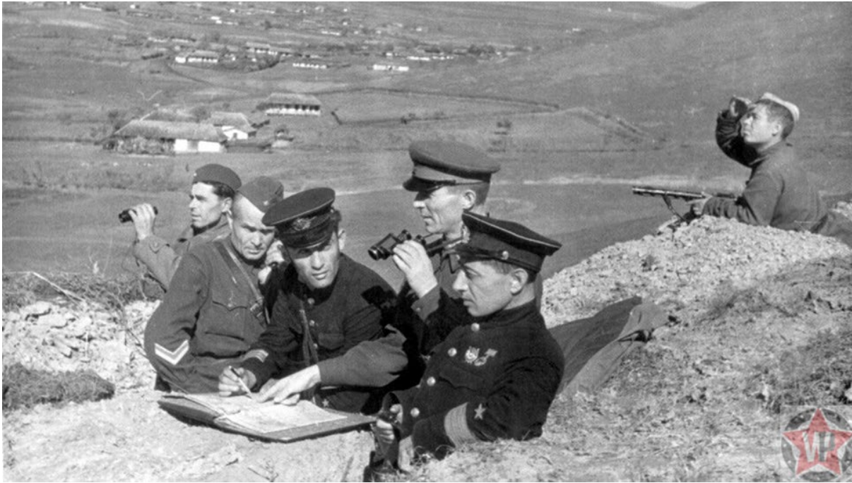
Командиры Красной армии и флота ведут наблюдение под Сталинградом

Ставка вермахта не прекращала попытки найти выход из сложного положения. С Северного Кавказа было приказано перебросить две танковые армии. Паулюсу велели не отходить из Сталинграда. Гитлер не желал мириться с тем, что ему придется отступить от Волги. Последствия этого решения станут фатальными как для армии Паулюса, так и для всех немецко-фашистских войск.