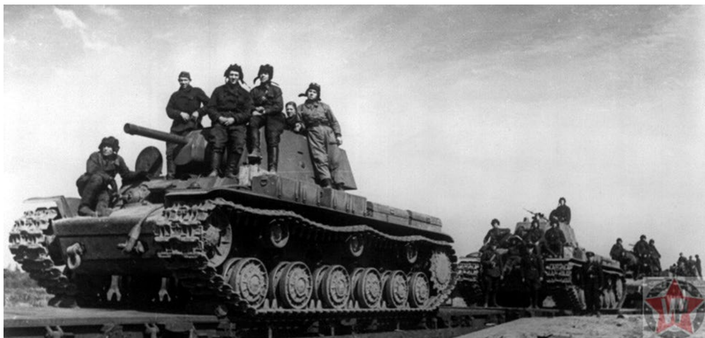
Экипажи и танки КВ-1 в ходе переброски под Сталинград

С 14 ноября, согласно директиве Гитлера, немецкие войска перешли к стратегической обороне. Наступательные действия продолжались только на сталинградском направлении, где противник штурмовал город. Войска группы армий «Б» занимали оборону от Воронежа на севере до реки Маныч на юге. Самые боеспособные части находились под Сталинградом, а фланги обороняли румынские и итальянские войска. В резерве у командующего группы армий было 8 дивизий, из-за активности советских войск на всей протяженности фронта он был ограничен в глубине их применения.