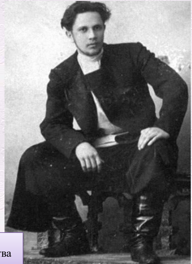
А.Н. Толстой в годы студенчества