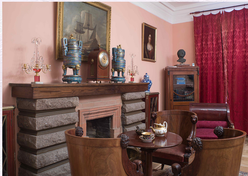
Музей-квартира А.Н. Толстого в Москве