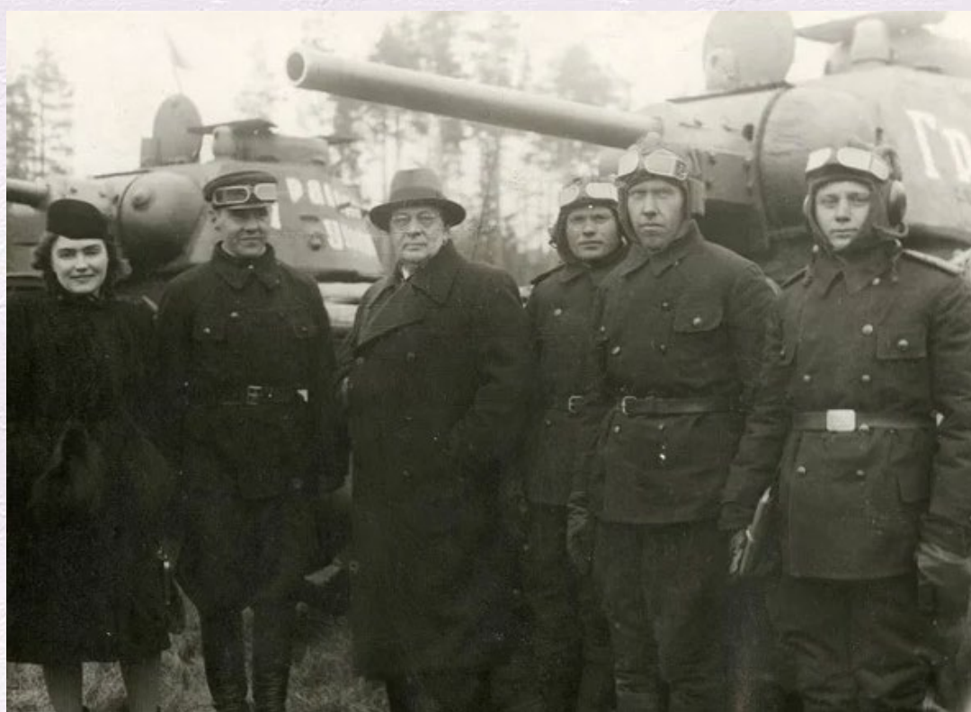
А. Н. Толстой с женой и экипажем танка «Грозный», построенным на Сталинскую премию писателя

Всего за военные годы Алексеем Толстым опубликовано более 100 статей. Автор также писал тексты для выступлений, которые звучали по громкоговорителям и печатались в газетах, был членом комиссии по расследованию злодеяний фашистских оккупантов. 30 марта 1943 года в газете «Известия» было опубликовано письмо Толстого к Сталину с просьбой направить сто тысяч рублей Сталинской премии за роман «Хождение по мукам» на постройку танка. Ниже редакция поместила ответ Сталина, который заканчивался так: «Ваше желание будет исполнено, И. Сталин».