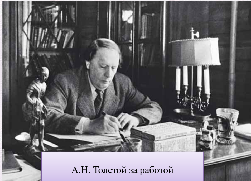
А.Н. Толстой за работой

Многие произведения Алексея Николаевича Толстого были экранизированы. Это «Хромой барин», «Хождение по мукам». Есть целый ряд фильмов, основой для которых стали книги Алексея Толстого: «Детство Никиты», «Гиперболоид инженера Гарина», «Золотой ключик», «Аэлита», «Формула любви», «Петр Первый», «Юность Петра». Стоит отметить, что Алексей Толстой является лауреатом трёх Сталинских премий! Одна из них присуждена была за неоконченный в то время роман «Пётр Первый».