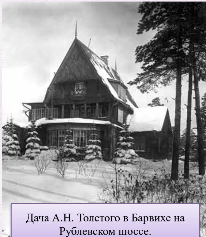
Дача А.Н. Толстого в Барвихе на Рублевском шоссе.

Толстой брался за любую работу, параллельно демонстрируя лояльность к советской власти. В 1930-х годах он окончательно вошел в литературную элиту СССР, а после смерти Максима Горького возглавил Союз писателей СССР .