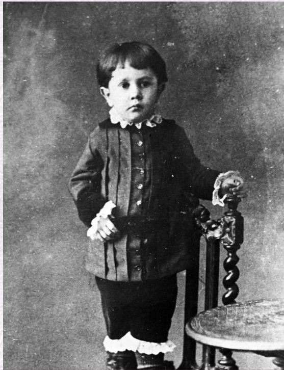
Алексей Толстой в детские годы