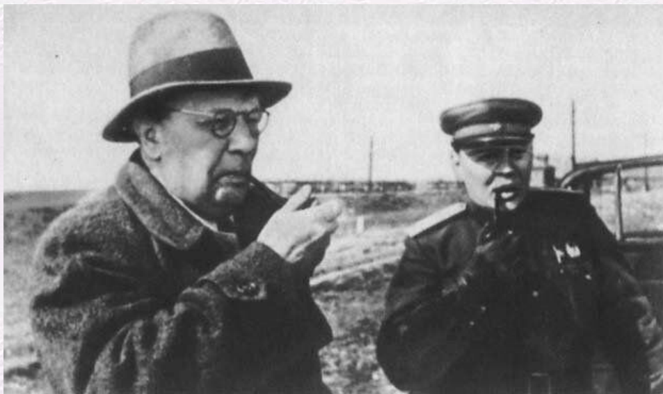
А.Н. Толстой на фронте, 1943 г.

В творчестве Алексея Толстого – и художественном, и публицистическом – в это период тесно переплетаются две темы – Родины и внутреннего богатства национального характера русского человека. С наибольшей полнотой это единство воплотилось в «Рассказах Ивана Сударева», первый цикл которых появился в «Красной звезде» в апреле 1942 г., а последний – «Русский характер» – на страницах этой же газеты 7 мая 1944 г.