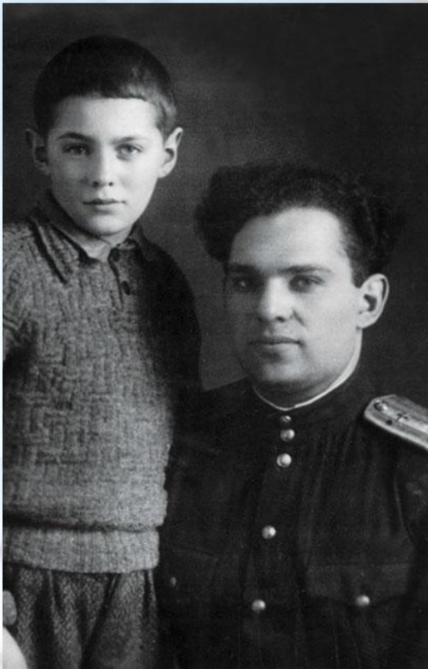
Леонид Рошаль с отцом

Леонид Рошаль родился 27 апреля 1933 года в городке Ливны Центрально-Черноземной области. Сейчас это Орловская область. Отец у него был военным летчиком и из-за его работы, семья постоянно переезжала и меняла место жительства. Учился он хорошо, больше внимания уделял биологии и физике.