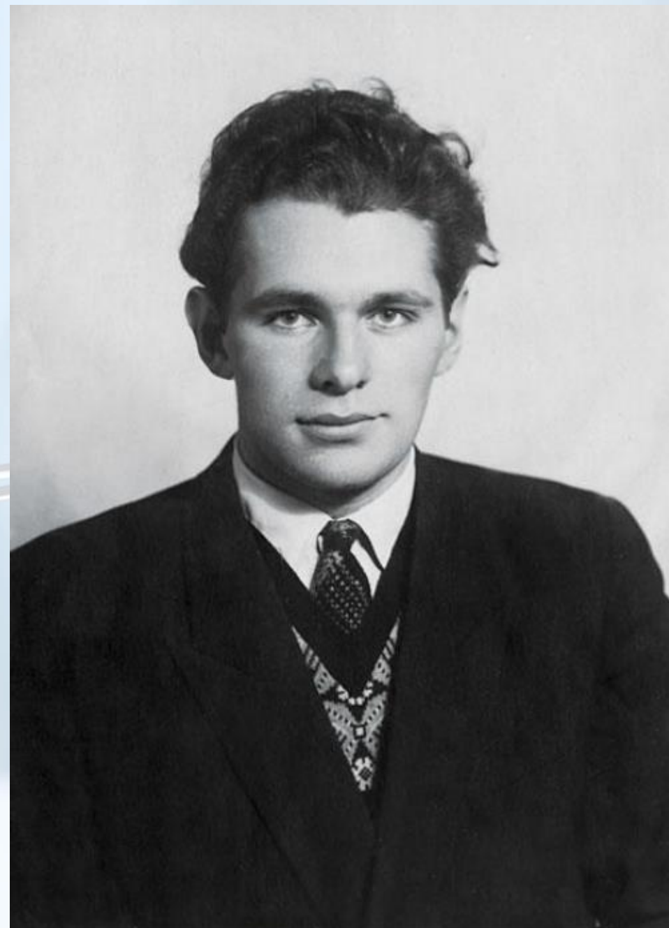
В студенческие годы