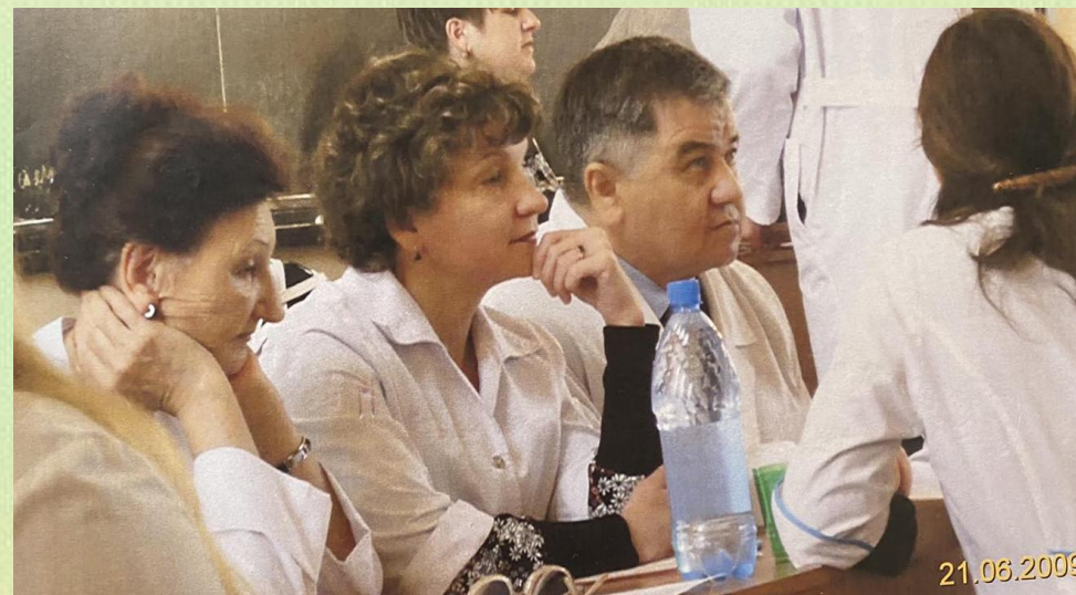
На экзамене, 2009 г.