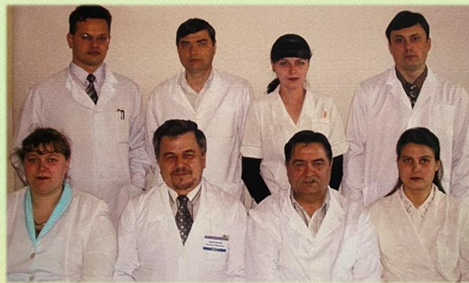
С сотрудниками кафедры