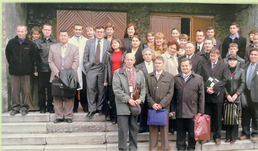
Юбилейная конференция хирургов, 2003 г.

Им опубликовано 634 научные работы, в том числе 88 учебно-методических издания. Большая часть работ опубликована в трудах съездов хирургов, в рецензируемых и ВАК журналах. С грифом МЗ СССР в Москве в издательстве «Учмедпособие» опубликовано два учебных пособия и 2 пособия с грифом УМО МЗ РФ. Все пособия используются для качественного преподавания на кафедрах и на циклах усовершенствования врачей. Подготовил и издал 7 монографий по результатам своей научно-исследовательской и практической деятельности, одна из которых «Цеолиты в хирургии» получила признание и за рубежом. Многократно с результатами своих исследований выступал на Всесоюзных, Всероссийских, республиканских, международных и региональных форумах ученых и врачей.