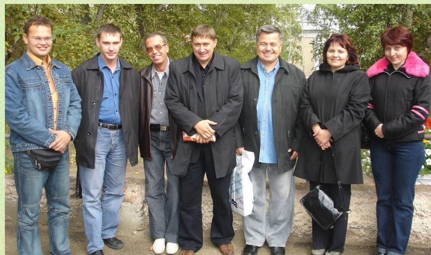
Читинская делегация в Улан-Удэ, 2006 г.