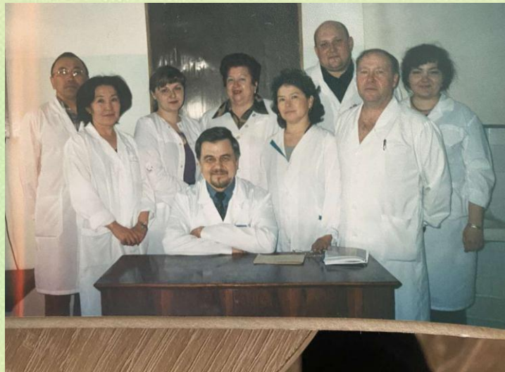
с группой курсантов цикла «Проктология» 1988 г., 2004 г.

«Люди идут к врачу за помощью. И это великий дар судьбы, небес – возможность, способность помочь им»