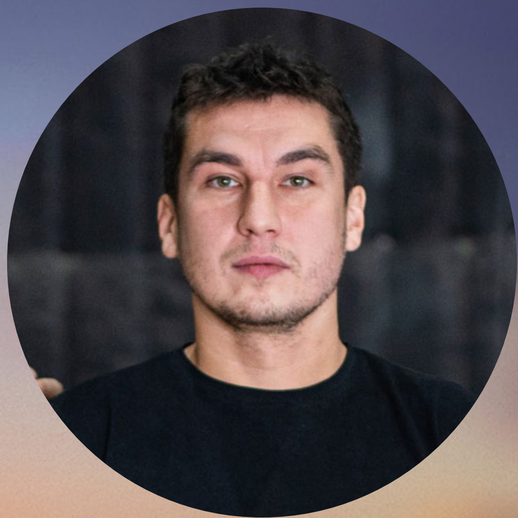
РОМАН КАРИМОВ РЕЖИССЁР

« ДЛ Я МЕН Я ЭТО КИНО О ТОМ, КАК ЛЮДИ НЕ СДАЛИСЬ — ВЕРИЛИ В ЛУЧШЕЕ И ПОНИМАЛИ, ЧТО ВЗАИМОПОМОЩЬ ПРИВЕДЁТ К СПАСЕНИЮ. »