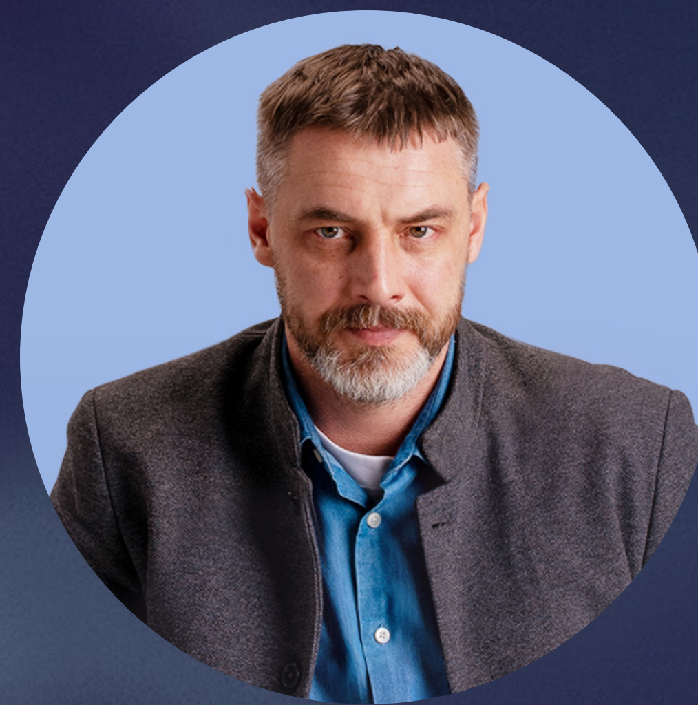
АНТОН БАТЫРЕВ АКТЁР

« ДЛ Я МЕН Я ЭТО КИНО О ТОМ, КАК ЛЮДИ НЕ СДАЛИСЬ — ВЕРИЛИ В ЛУЧШЕЕ И ПОНИМАЛИ, ЧТО ВЗАИМОПОМОЩЬ ПРИВЕДЁТ К СПАСЕНИЮ. »