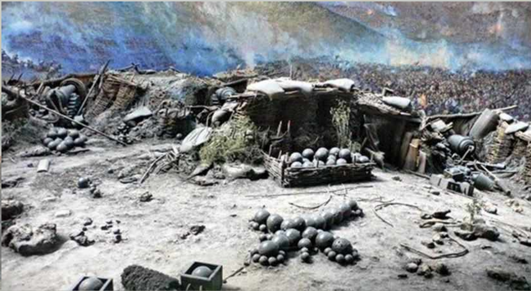
Крест на месте гибели адмирала Корнилова. Часть панорамы Ф. А. Рубо "Оборона Севастополя"