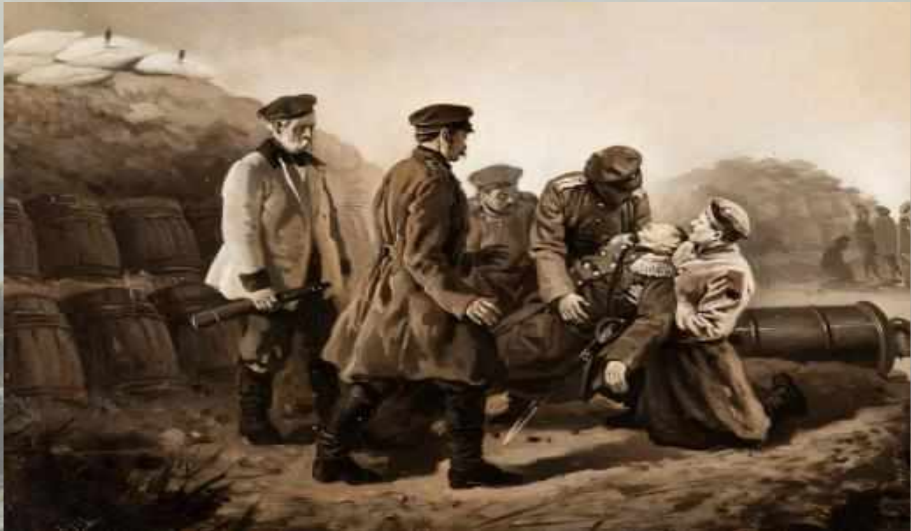
Маковский В.Е. «Смертельное ранение адмирала П.С.Нахимова 28 июня 1855 года». Из альбома «Эпизоды Севастопольской жизни 1854-1855 годов».