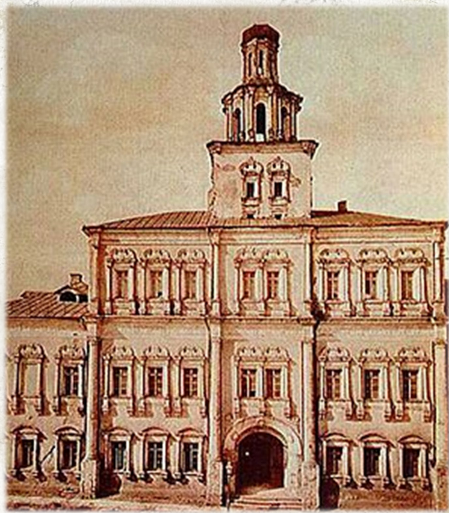
Фасад первого здания Императорского Московского университета, где находился медицинский факультет (XVIII век)