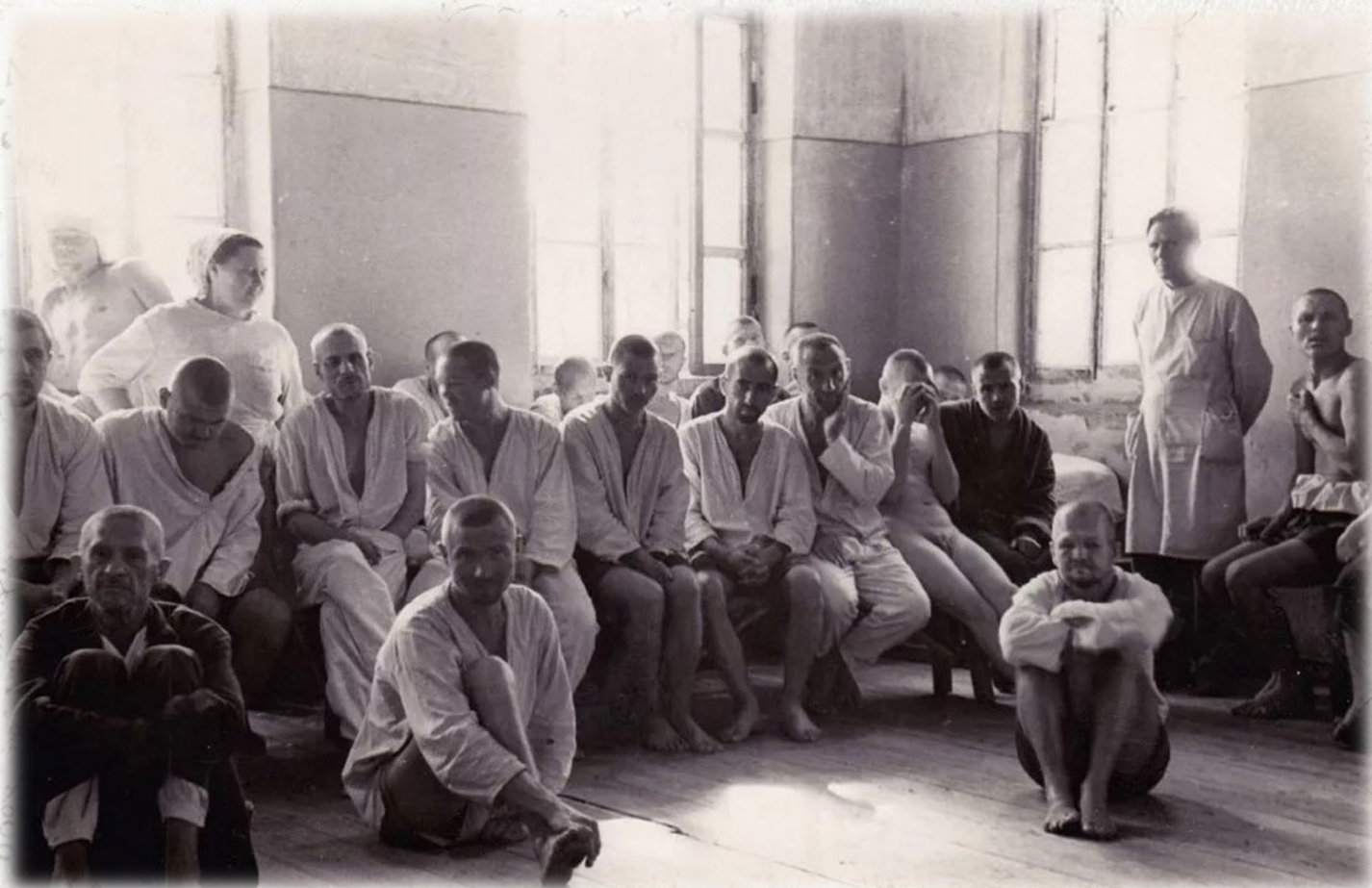
Пациенты психиатрической клиники

Как лечащий врач С.С. Корсаков пользовался большой популярностью. Бескорыстие делало его доступным и для неимущих больных. Он очень быстро стал врачом, что называется, нарасхват, урывавшего для лечебницы часы от своего отдыха. Сергей Сергеевич считал важным условием успешности лечения привязанность больных к учреждению и персоналу, настаивал на необходимости для врачей входить в личную жизнь больных и быть для них не только врачами, но и друзьями.