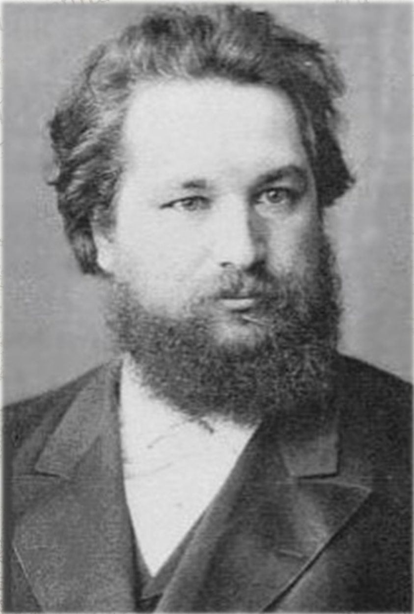
Молодой психиатр С.С. Корсаков