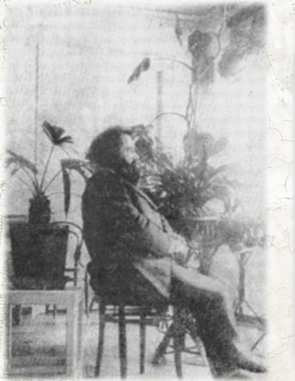
С.С. Корсаков незадолго до смерти (апрель 1900 г.)

20 июня 1898 года Корсаков отправился в отпуск. По дороге, в Вологде, у него случился сердечный приступ. Полежав 5 дней, он вернулся в Москву, и здесь лечащие его врачи определили ожирение сердца. В середине июля у него случился второй сердечный приступ. Затянувшаяся болезнь вынудила его подать прошение об освобождении от ведения практических занятий со студентами. Декан медицинского факультета И.Ф. Клейн передал руководство занятиями В.П. Сербскому. 21 июня 1889 года Сергей Сергеевич поехал в Вену для консультаций со специалистами. У него обнаружили гипертрофию сердца в связи с ожирением и миокардитом. Из Вены он направился в Рогац, где принимал ванны и делал гимнастические упражнения в институте доктора Баяли. Пробыв за границей до 25 августа, он почувствовал значительное улучшение.