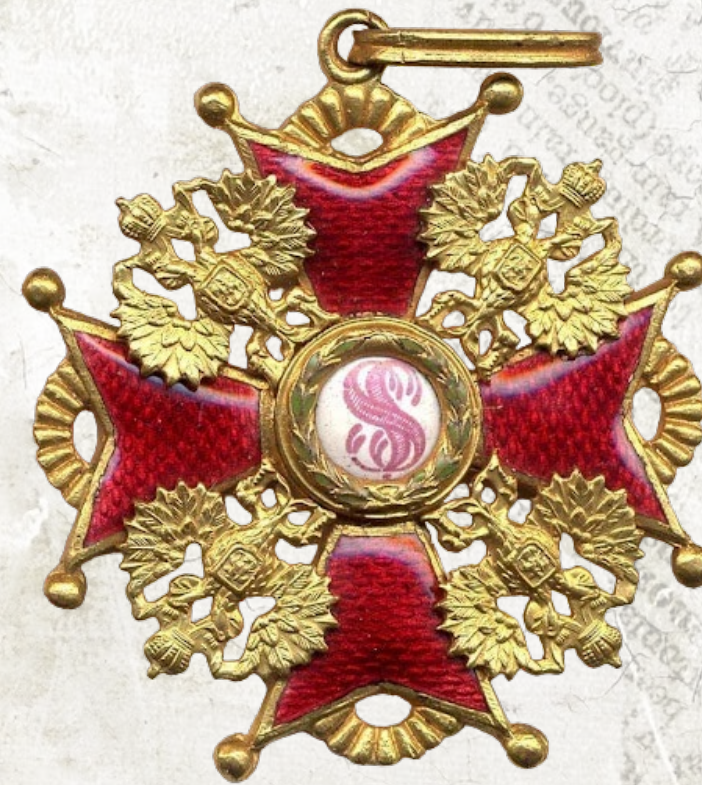
Орден Святого Станислава 2 степени

1 января 1893 года одного из основоположников отечественной психиатрии - Корсакова награждают орденом Св. Станислава 2-й степени. Созданная им школа русской психиатрии определила пути развития отечественной психиатрии и утвердила ее мировое значение. Среди его трудов особое значение имеет исследование психических расстройств при алкогольном полиневрите (полиневротический психоз). Эта работа создала эпоху в психиатрии, положив начало нозологическому направлению в изучении психических болезней. Основным в учении Корсакова является описанный им в работе «Болезненные расстройства памяти и их диагностика» (1890 г.) своеобразный тип расстройства памяти, характеризующийся нарушением запоминания, ориентировки во времени и обманами памяти. Эти три симптома, входящие в «корсаковский синдром», встречаются при ряде психических заболеваний.