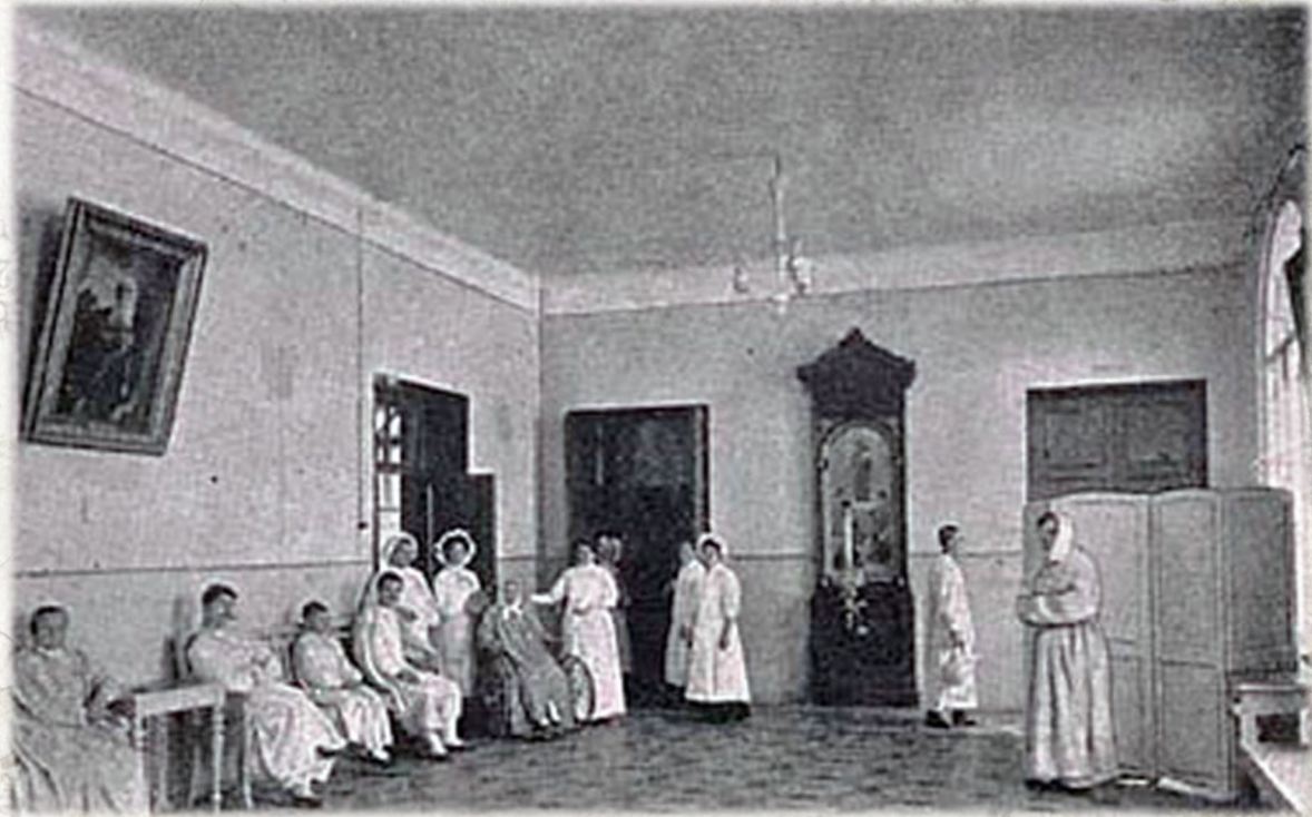
Старые изображения Преображенской больницы

12 августа 1897 года на XII Международном съезде психиатров в Москве профессор Жолли из Берлинского университета вносит предложение именовать полиневротический психоз, описанный и исследованный впервые Корсаковым, «Корсаковским психозом». Корсаковский больной не помнит то, что было с ним несколько минут назад. Стоит ему отойти от стола с шахматной доской или с едой, и он будет утверждать, что не играл и не ел. Меньше всего у корсаковских больных страдает память двигательных навыков, привычек - всего, что заполняет сферу бессознательного автоматизма. Второе место по стойкости занимает память чувств - способность к запоминанию не столько самого объекта, сколько его значения. Третье - образная память на места и формы. И на самом последнем месте - память времени, способность фиксировать внешние и внутренние процессы, события и динамику мысли.