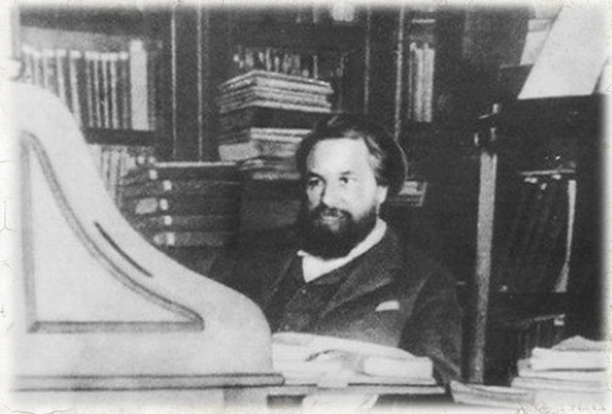
Корсаков С.С. в рабочем кабинете

Сергей Сергеевич часто навещал за границу для знакомства с их методами психиатрического лечения. Свою первую поездку он совершил в 1885 году к Теодору Мейнерту в Вену. В 1889 году он едет в Германию, Швейцарию, Францию, Италию. В Берлине он посещает клинику Шаритэ. В Лейпциге Корсаков побывал в психиатрической клинике невролога Пауля Эмиля Флексига (1847-1929), одного из основоположников современной нейроморфологии, который познакомил его с коллекцией микроскопических препаратов. Здесь же, в Лейпциге, в июле, Корсаков знакомится с Институтом физиологии и психологии Вундта.