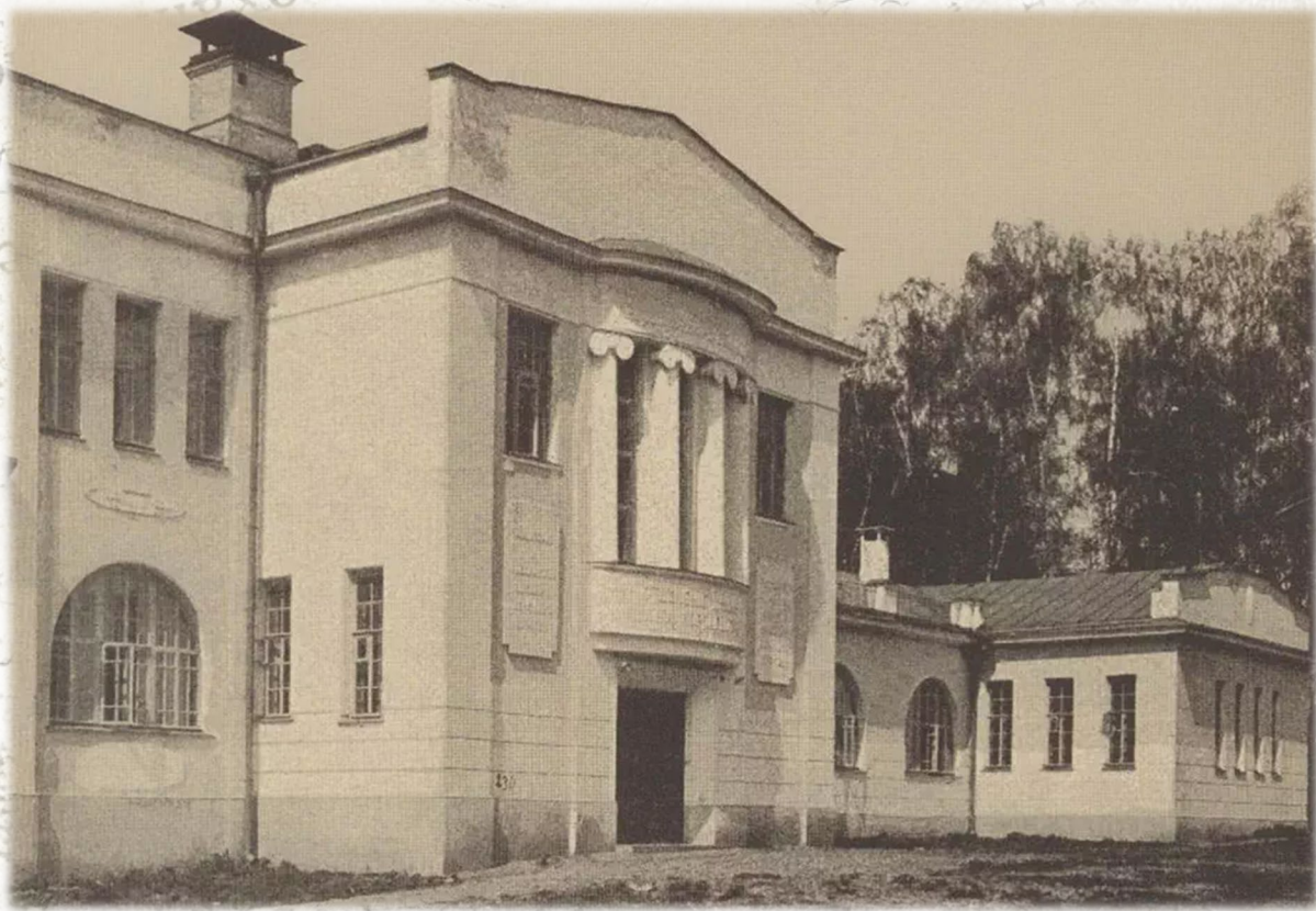
Преображенская психиатрическая больница