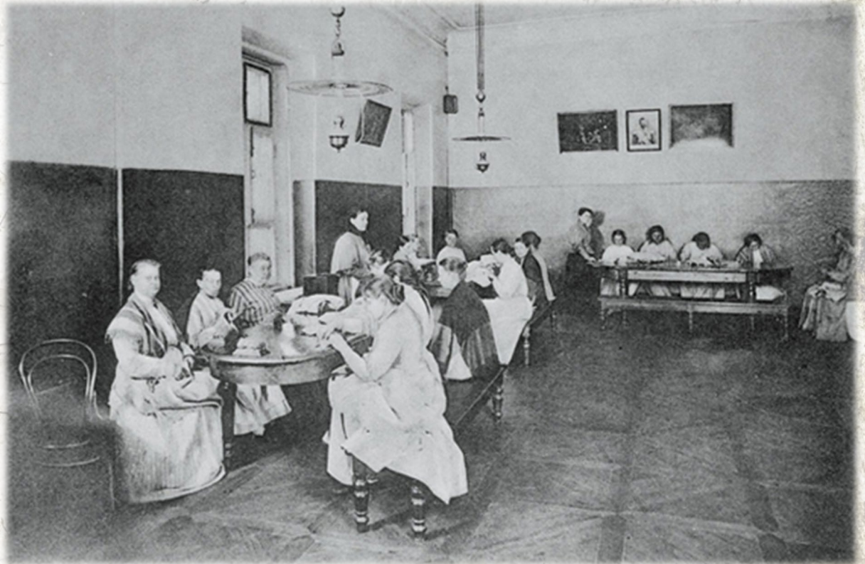
Пациентки Преображенской больницы за рукоделием

Ни до, ни после него не было психиатра, который бы проводил столько времени со своими больными. Дневал и ночевал в клинике, жил в ней без выходных. Кабинетных приемов почти не вел - беседовал с пациентами где попало, то усаживаясь на койку, то где-нибудь в уголке за шахматами, в домашней одежде.