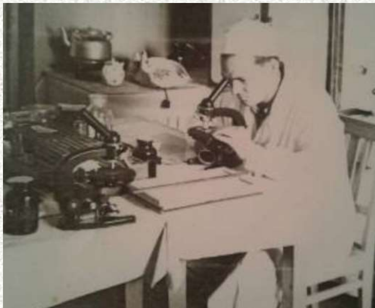
Работа в лаборатории, г. Ижевск

«...В Ижевске отец заболел – внезапно его свалил диэнцефальный синдром, от которого не было на то время способа излечения. Он сам решил вылечить себя и перешел на растительное питание, стал практиковать индийскую йогу и усиленно изучал индийскую философию. Одновременно он регулярно занимался изучением иностранных языков – английского, немецкого и французского, читал книги на этих языках. Ему удалось значительно улучшить свое здоровье, он ежедневно бегал и занимался физкультурой на улице, сердечные приступы и приступы диэнцефальной эпилепсии прошли, но панические атаки преследовали его до конца жизни...»