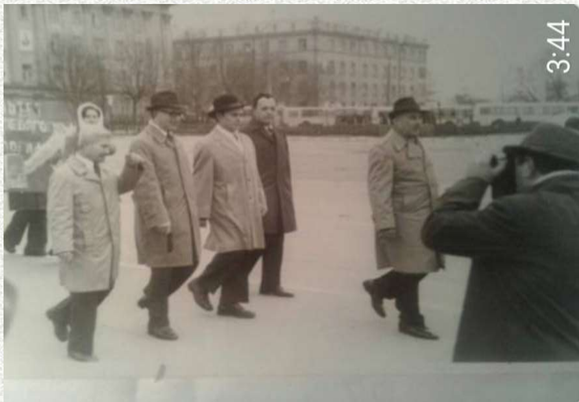
г. Бельцы, Молдавия