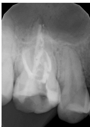
Зуб 1.6, 18.10.19 г Рис. 1 Временная obturation

Применение современных эндодонтических методик при лечении зубов с апикальной резорбцией: формирование искусственного апикального барьера в виде пробки из MTA не менее 3 мм, проведение постоянной obturation системы корневых каналов и восстановление коронки зуба качественной, герметичной реставрацией, позволяет значительно сократить время лечения пациентов и прогнозировать положительный исход заболевания.