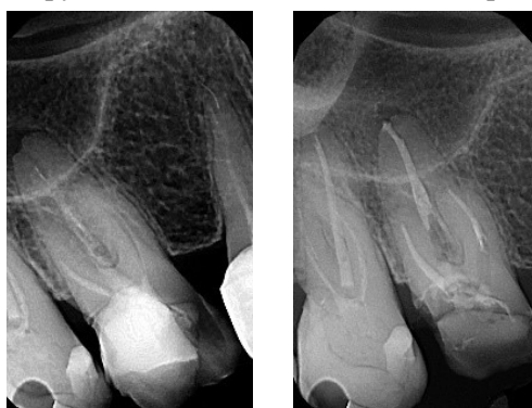
Рис. 3. Вурасс без извлечения инструмента зуб 1.6 (отломок инструмента в небном корневом канале)

Таким образом, механистический подход для решения проблемы сломанного инструмента – попытка удаления в любом случае, не верен. Процедура удаления фрагмента сломанного инструмента связана с потерей здорового дентина корня. В процессе этой процедуры могут быть перфорации либо, как отсроченное осложнение вследствие ослабления зуба, может возникнуть вертикальная трещина корня. Поэтому каждый успешно проведенный вурасс для врача – это маленькая победа рабочего дня!