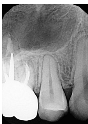
Зуб 1.6, 10.01.21 г Рис.3. ч/з 2 года