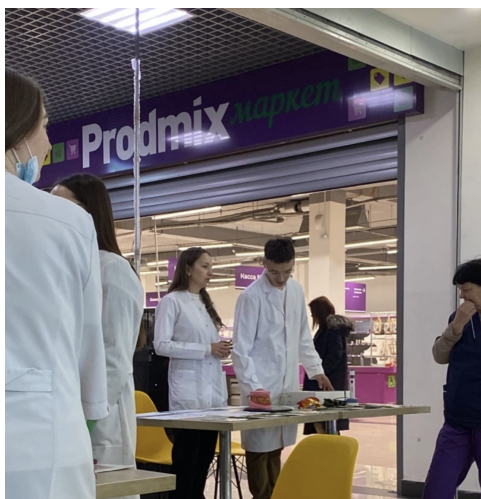
Рис. 2. Студенты 4 курса работают в ТЦ «Столица»

Мероприятия профилактической направленности должны регулярно и в обязательном порядке проводиться для населения края и города, так как это позволяет выявлять заболевания и своевременно решать проблемы диагностики и терапии в необходимых случаях.