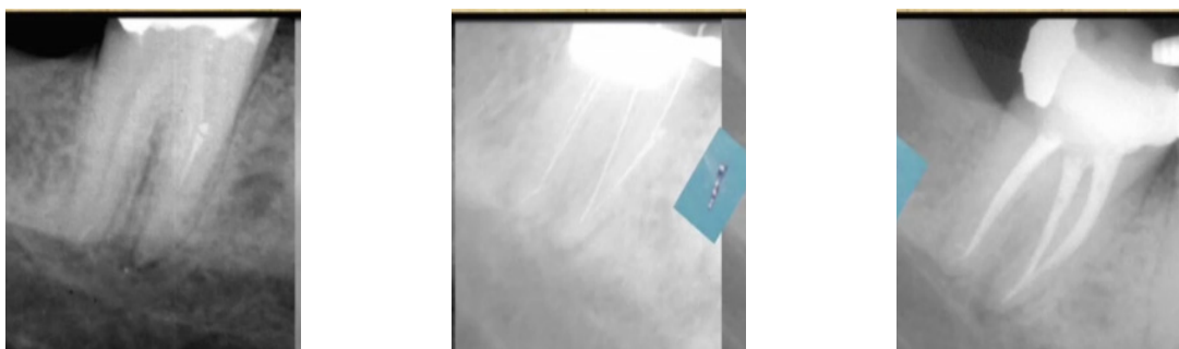
Рис. 1. Методика Вурасс с извлечением инструмента из медиально-щечного корневого канала зуба 4.6.

При прохождении рядом со сломанным инструментом возможно его извлечение – методика Вурасс с извлечением инструмента (рис.1).