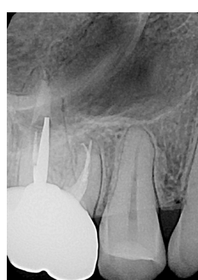
Зуб 1.6, 10.03.23 г Рис. 4. ч/з 4 года