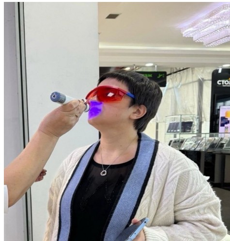
Рис 1. Осмотр красной каймы на светодиодном стоматоскопе АФС

и заинтересованностью посещали нашу площадку, задавали множество вопросов и уходили удовлетворёнными, ставшими немного грамотней в вопросах профилактики стоматологических заболеваний.