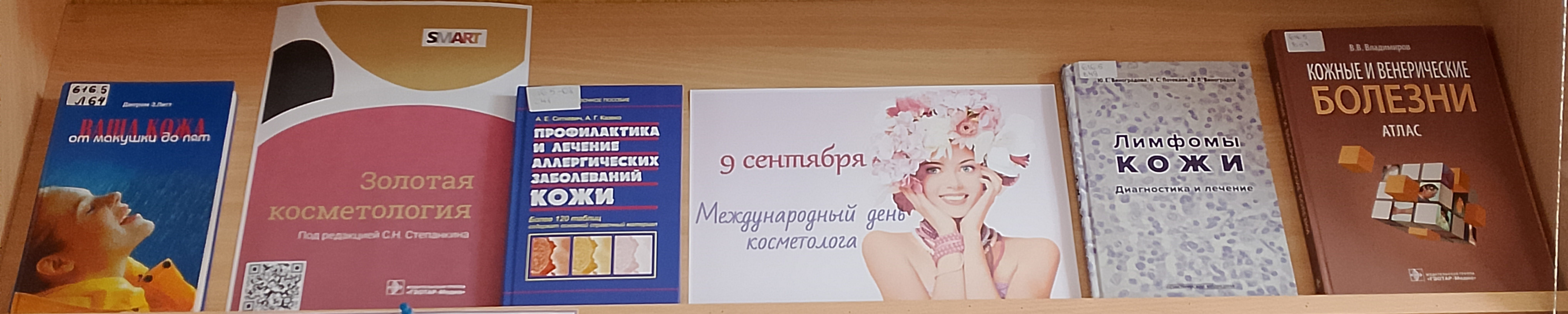
Уход за кожей