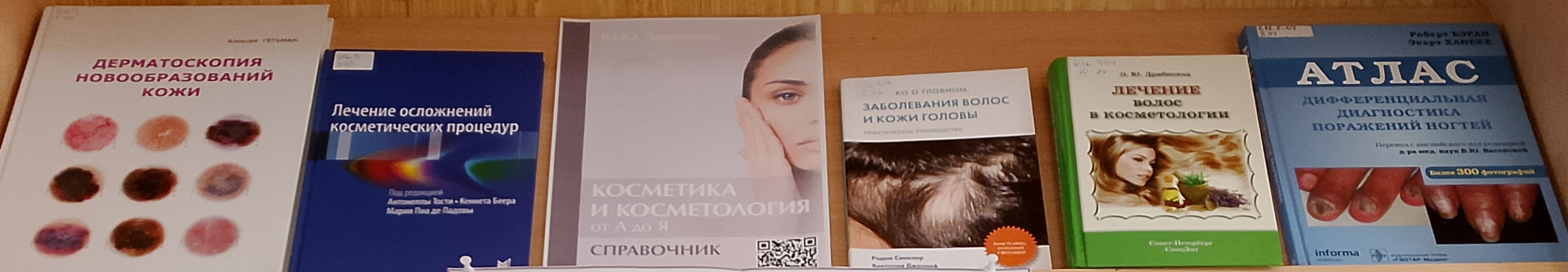
Актуальные вопросы косметологии