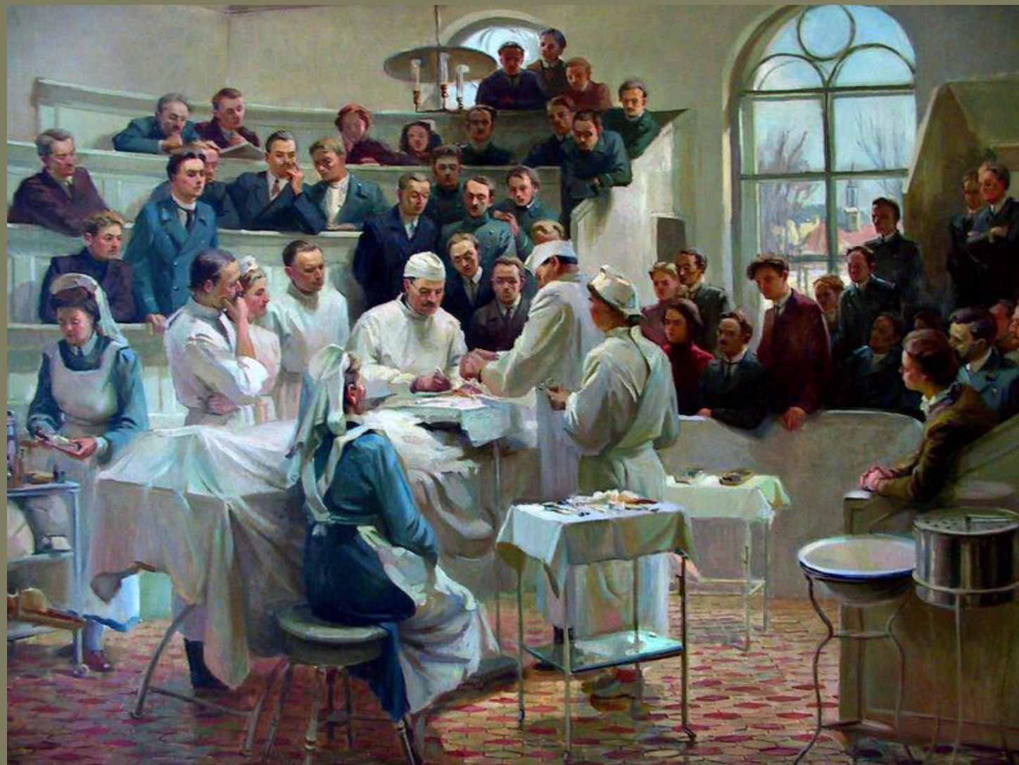
А.И. Куинджи. Показательная операция в клинике Пирогова

"Из всех наук, без сомнения, медицина самая благородная" - Гиппократ.