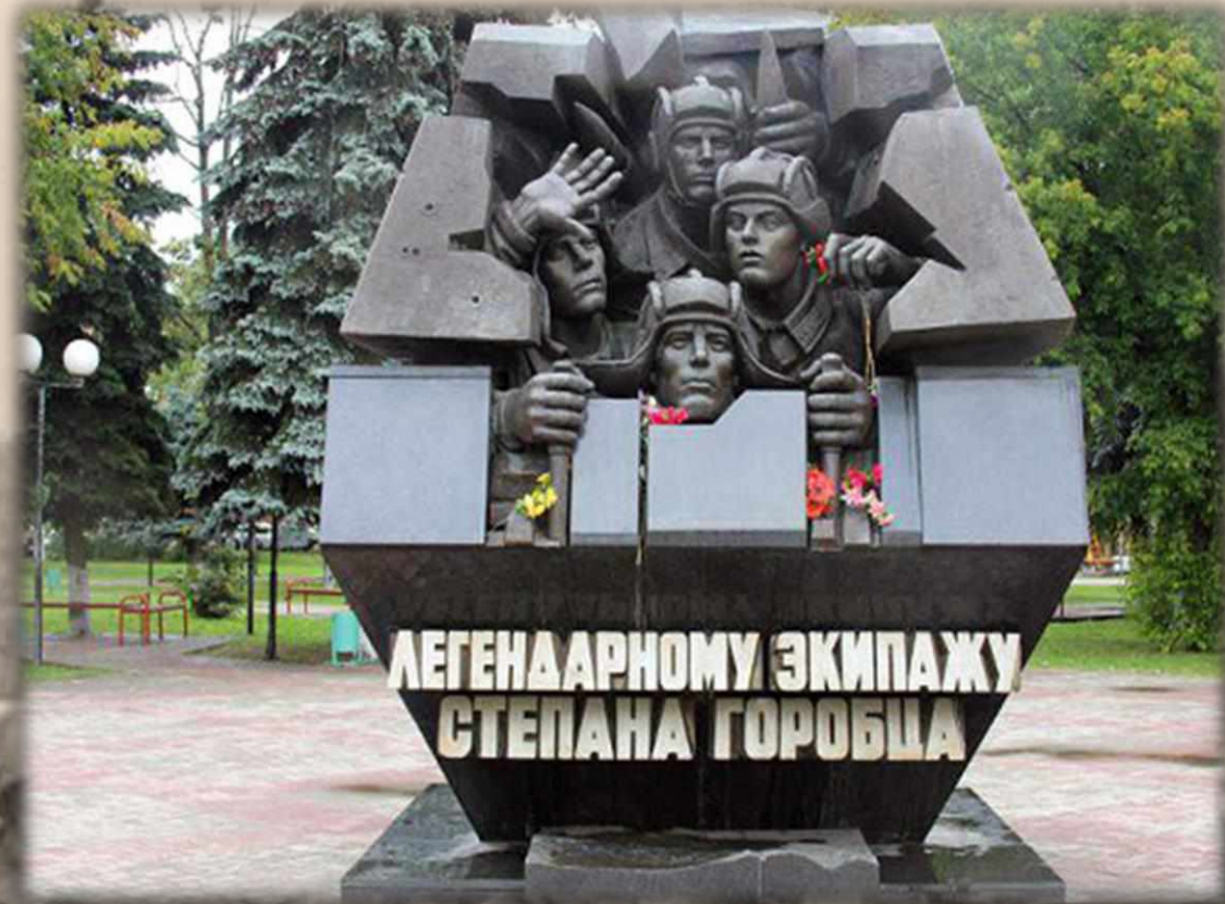
Памятник танковому экипажу Степана Горобца в городе Тверь

Указом Президиума Верховного Совета СССР от 5 мая 1942 года Горобец удостоен звания Героя Советского Союза .