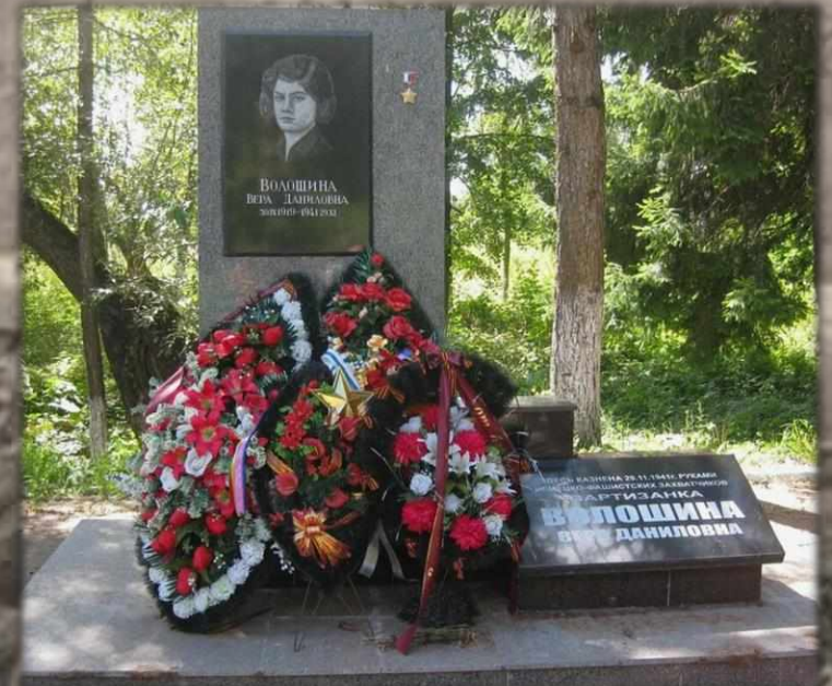
Памятник на месте гибели Веры Волошиной