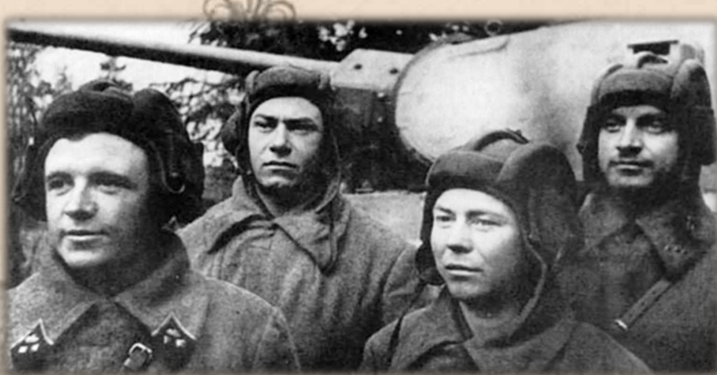
Танковый экипаж Дмитрия Лавриненко октябрь 1941 г.

18 декабря 1941 года разгорелись бои в районе Волоколамска. Под руководством Лавриненко танкисты уничтожили немецкий гарнизон у села Покровского и в районе деревни Горюны. После боя фашисты начали массированный артиллерийский обстрел деревни. Осколок от взорвавшегося снаряда нанес танкисту смертельное ранение. Лавриненко готовили к присвоению звания Героя Советского Союза , но документы где-то затерялись. Высокое звание Дмитрий Федорович получил посмертно спустя много лет в 1990-м году.