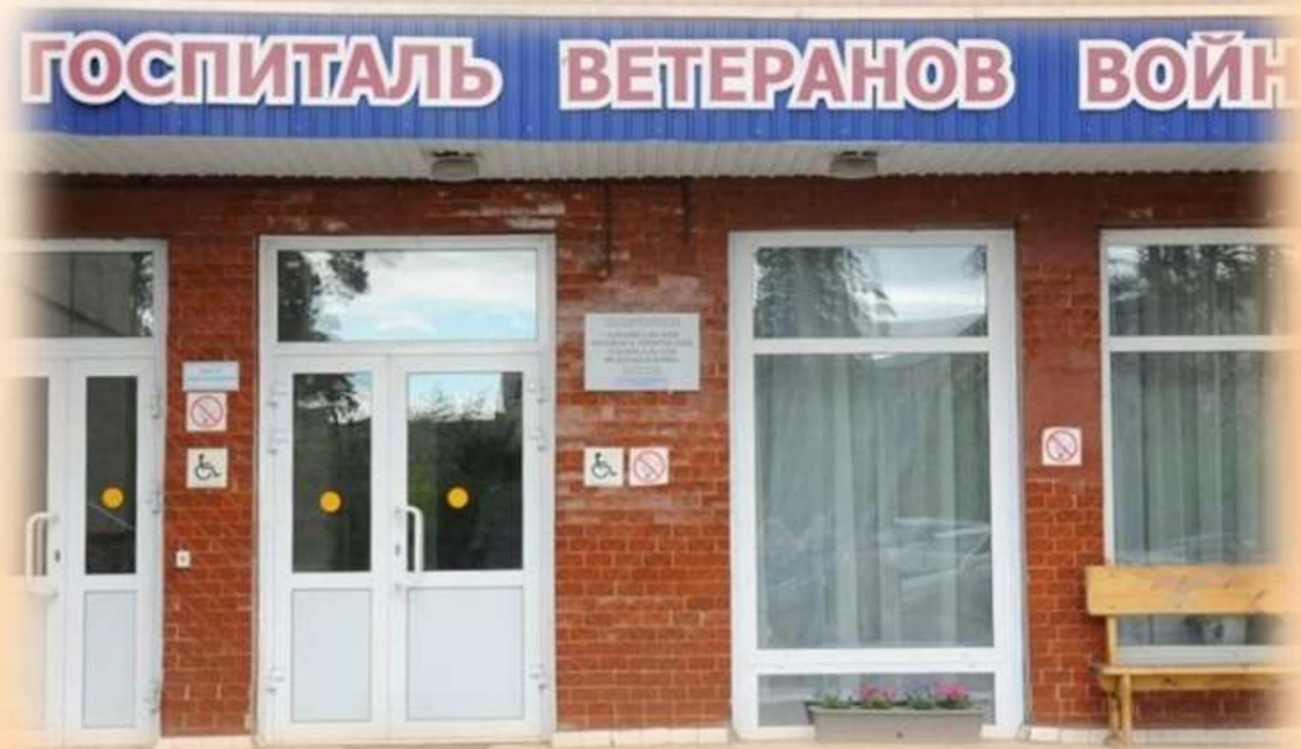
Современное здание госпиталя