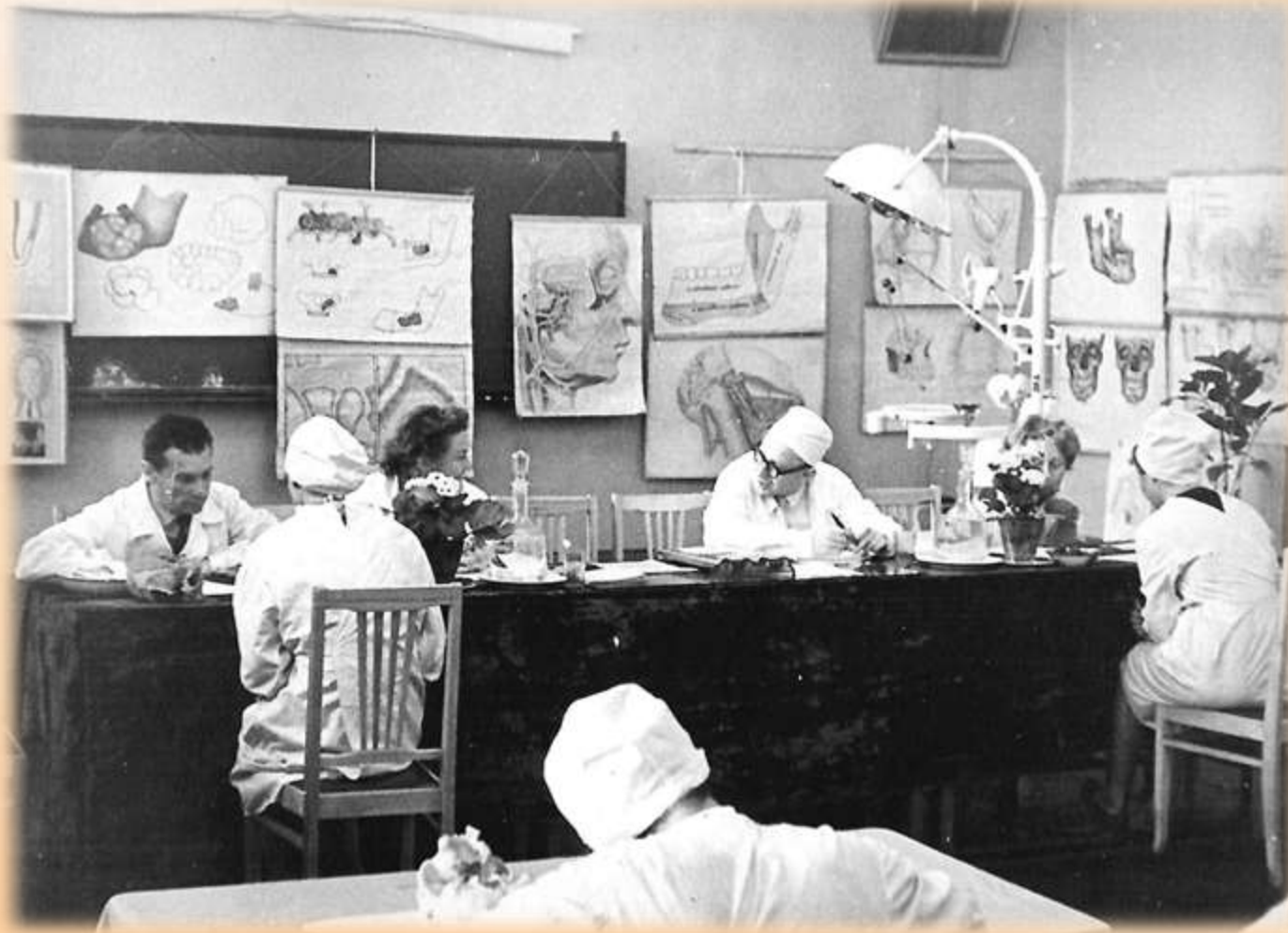
Государственный экзамен у стоматологов, 1964 г.