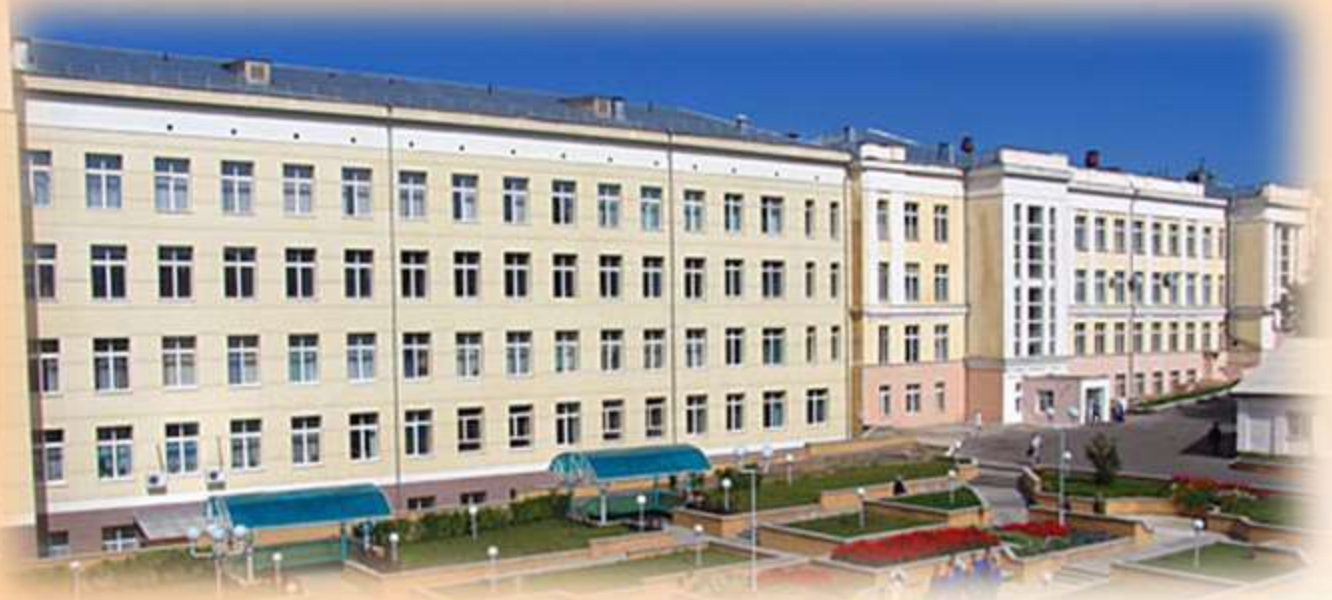
Современное здание 321 военного клинического госпиталя