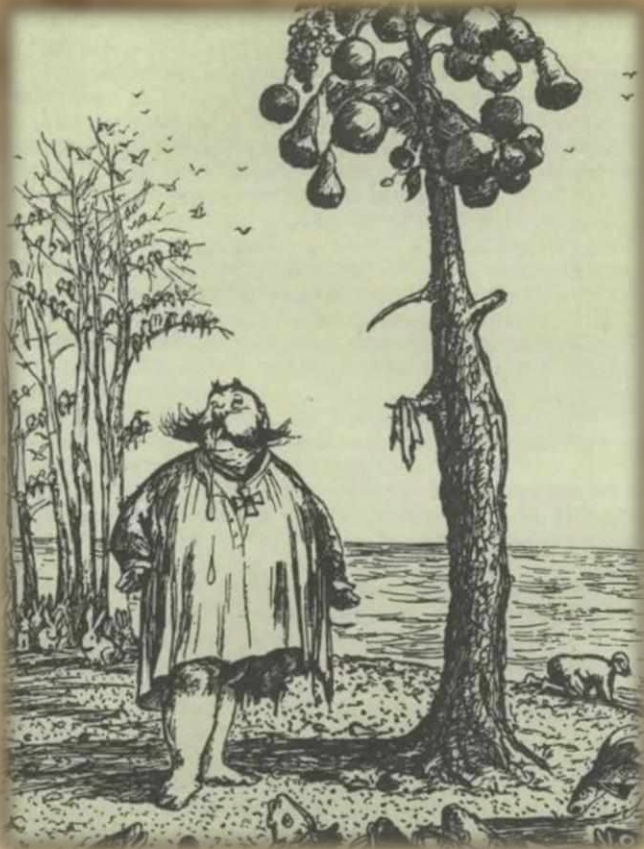
Кукрыниксы. Иллюстрация к сказке «Как один мужик двух генералов прокормил»