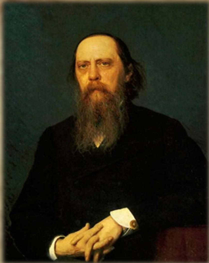
Портрет М.Е. Салтыкова-Щедрина кисти художника Ивана Крамского

Вернуться из ссылки Салтыкову было разрешено в декабре 1855 года. В 1856 году он поступил на службу в Министерство внутренних дел в качестве чиновника по особым поручениям. На этой должности Михаил Евграфович столкнулся с масштабными злоупотреблениями местных властей. В том же 1856 году Михаил Салтыков вернулся к литературной деятельности и начал публиковаться в различных петербургских журналах под псевдонимом «Николай Щедрин». Впоследствии этот псевдоним стал неразделимым с его настоящей фамилией.