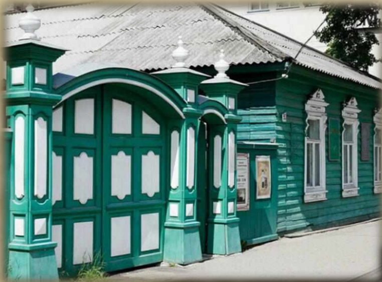
Дом-музей Салтыкова-Щедрина в Кирове

Одна из первых повестей Михаила Салтыкова – «Запутанное дело» – навлекла на себя гнев властей, и в 1848 году «за вольнодумство» он был выслан из столицы в Вятку (ныне Киров). Там писатель провёл семь лет на службе в губернской администрации. Литературную деятельность Салтыкову вести запретили, однако он занимался переводами и много читал.