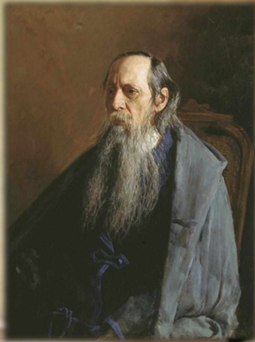
«Портрет М.Е. Салтыкова-Щедрина». Художник Н.А. Ярошенко. 1886 г.

В последние годы жизни Михаил Евграфович тяжело болел. Он скончался 10 мая 1889 года от нарушения мозгового кровообращения. Согласно последней воле самого писателя, похоронили его на Волковском кладбище в Санкт-Петербурге, рядом с могилой И.С. Тургенева. В 1936 году прах Салтыкова-Щедрина перенесли на Литераторские мостки – в музей-некрополь, где покоятся многие знаменитые деятели культуры, искусства, общественные деятели.