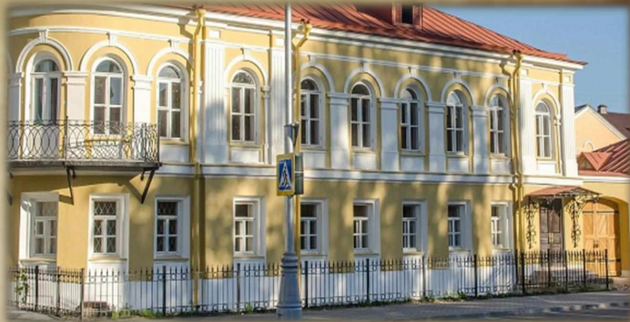
Музей Салтыкова-Щедрина в Твери

В 1858 году Салтыкова-Щедрина назначили вице-губернатором Рязани, а через два года перевели в Тверь. На службе он боролся со взяточничеством и воровством. Параллельно писатель печатал «Невинные рассказы» и «Сатиры в прозе», а также статьи по крестьянскому вопросу в журналах «Русский вестник», «Современник» и «Библиотека для чтения».