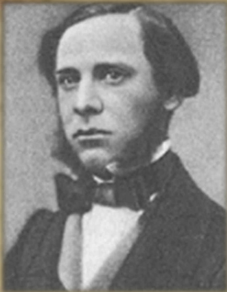
М.Е. Салтыков-Щедрин в юности

Все свободное от учебы время Салтыков сочинял стихи, переводил зарубежных поэтов, читал книжки, журналы и мечтал стать «наследником» Пушкина. Однако поэтический опыт оказался для Михаила не очень удачным, и он решил сосредоточиться на прозе. Впрочем, за юношеские стихи он успел пострадать: лицейское начальство сочло их «неблагонамеренными», и по окончании обучения Салтыков получил чин ниже, чем остальные, и стал не титулярным советником, а коллежским секретарем.