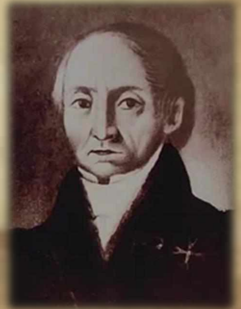
Евграф Васильевич, отец писателя