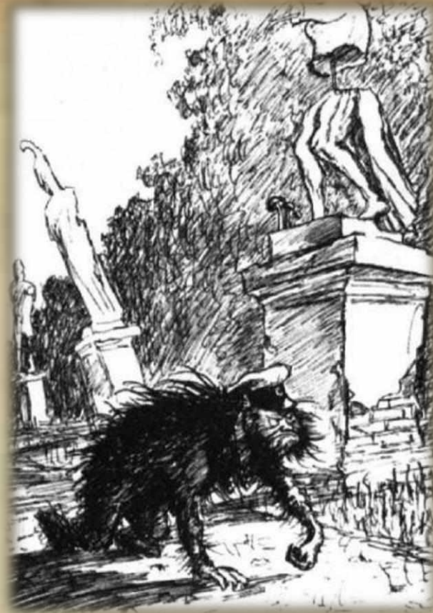
Кукрыниксы. Иллюстрация к сказке «Дикий помещик»

В 1869 году Салтыков-Щедрин создал свои первые сказки «Повесть о том, как один мужик двух генералов прокормил» и «Дикий помещик». В них писатель снова высмеивал помещичье-бюрократическую систему и воспевал крестьянский труд. Его сказки напоминали басни: в них были подтекст, мораль и много иносказаний.