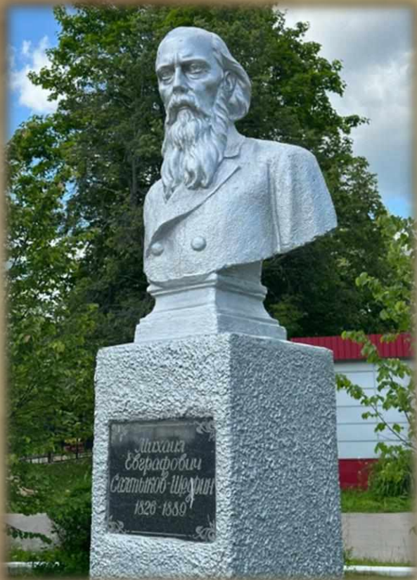
Памятник писателю в городе Спас-Угол

«Михаил Евграфович Салтыков – это всеми уважаемый диагност наших общественных зол и недугов»