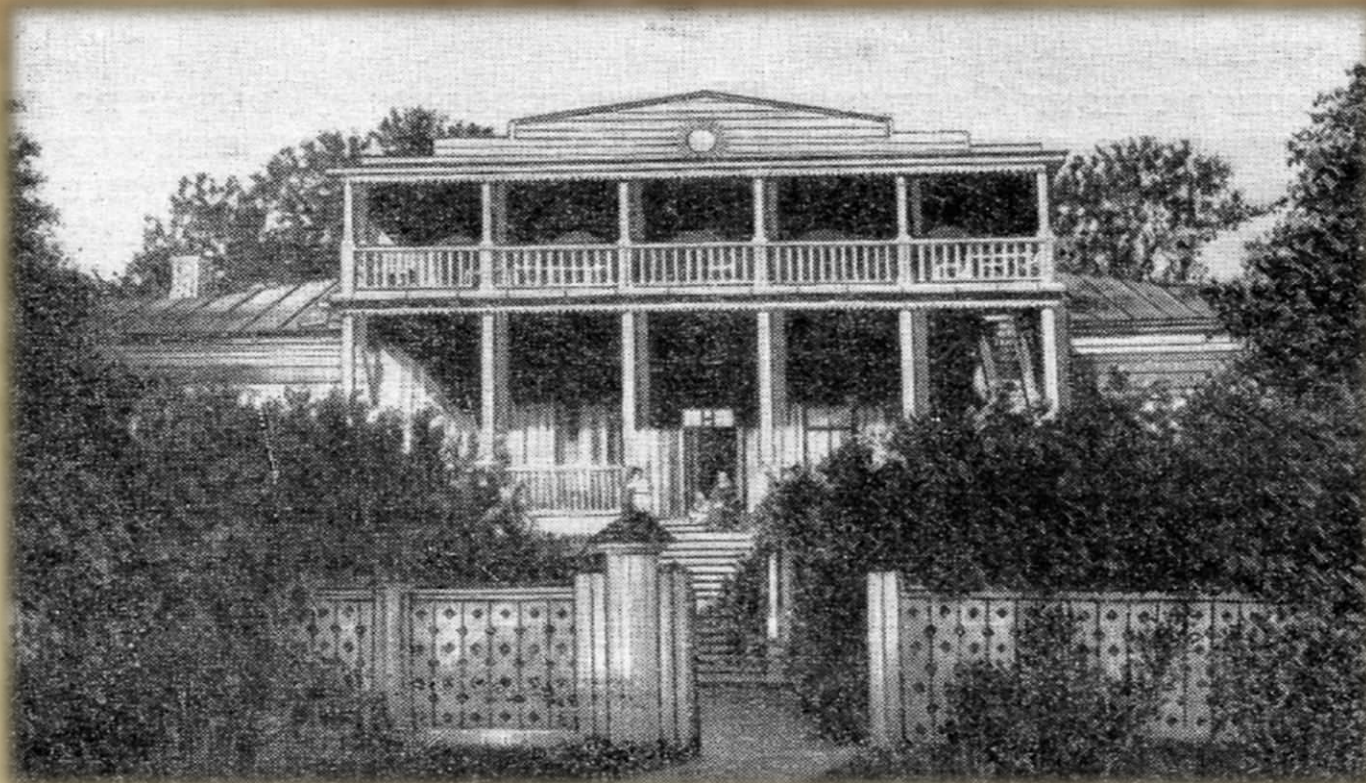
Спас Угол. Родовое имение Салтыковых. Фото до 1918 г. (в 1919 г. имение сгорело)