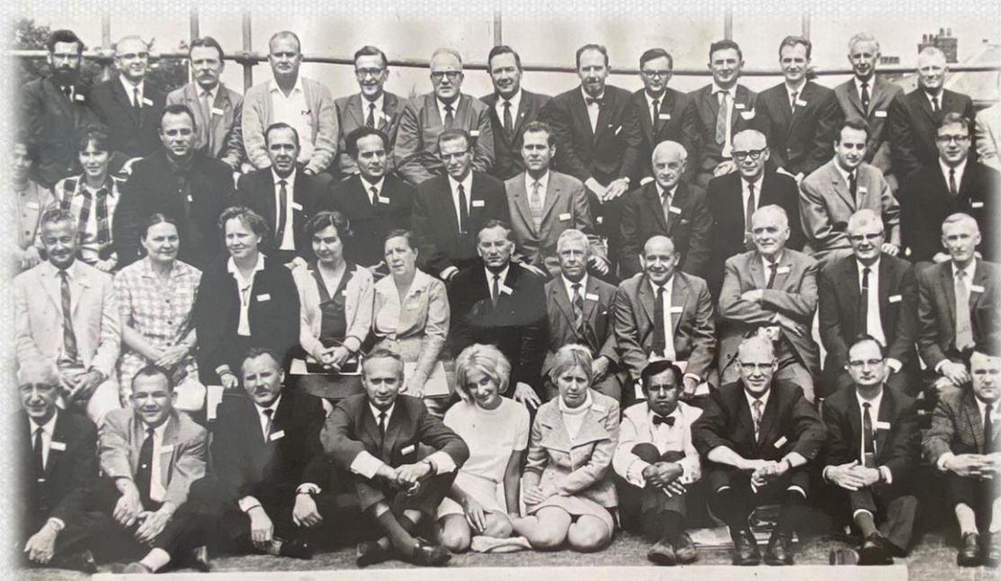
The SECOND INTERNATIONAL CONGRESS of ACAROLOGY SUTTON, BONINGTON - JULY 1967