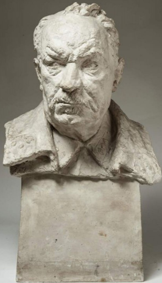
Н.Н. Бурденко, скульптор В.И. Мухина, 1946 г.