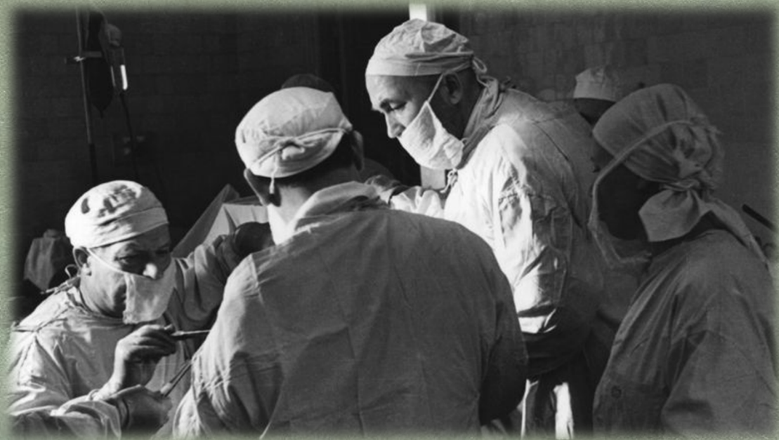
Николай Нилович (слева) во время операции

К началу Первой мировой войны он уже был профессором на кафедре оперативной хирургии Юрьевского университета. Однако, когда Европа превратилась в один большой театр военных действий, Бурденко не мог оставаться на своём месте. Сразу после объявления Первой Мировой войны уже известный хирург Бурденко сформировал хирургический отряд и был назначен заведующим медицинской частью Красного Креста на Северо-Западном фронте.