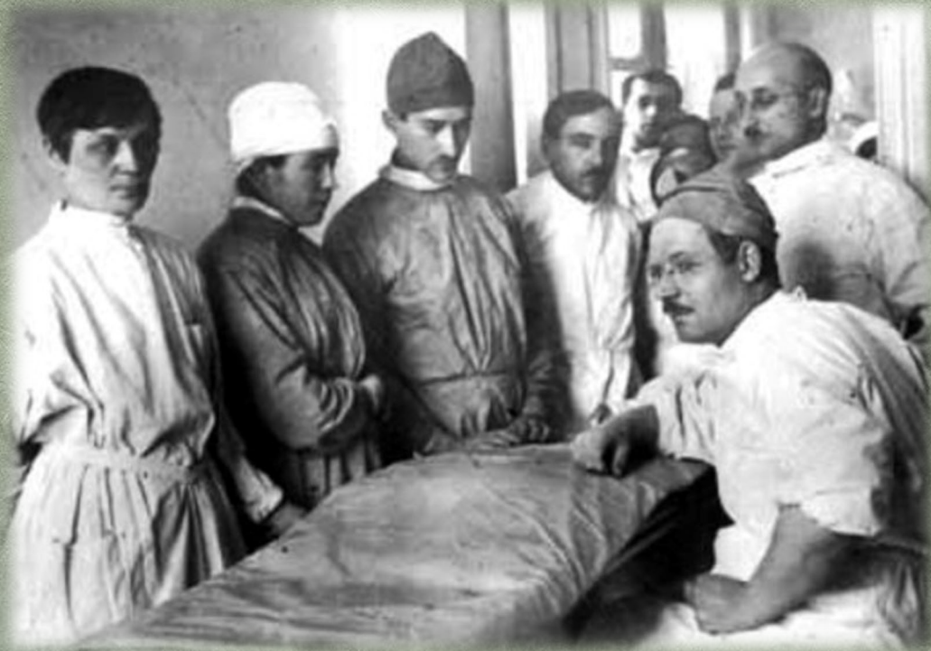
Н.Н. Бурденко в годы первой мировой войны

Нейрохирургией Николай Нилович, начал интересоваться еще во время русско-японской войны. Не изменял этой специализации хирургии и в годы Первой мировой. Уже в то время он организовал специальный госпиталь для нейрохирургических раненых, через который прошло более 3,7 тыс. человек. Не одна тысяча солдат была спасена посредством этих мер, Бурденко же работал неустанно до тех пор, пока сам не получил контузию в 1917 г.