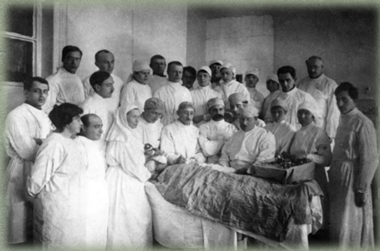
Бурденко с учениками

Сложный период революции и гражданской войны прошел для Николая Ниловича сравнительно благополучно – он не был в числе тех, кто не принял революцию и мучительно пытался сделать выбор. Стажированный участник революционной борьбы он уже давно определился в своих политических убеждениях и со всем присущим ему рвением и напором приступил к организации медицинской помощи уже в новых условиях. Бурденко – военный хирург, организатор работы госпиталей для раненых красноармейцев.