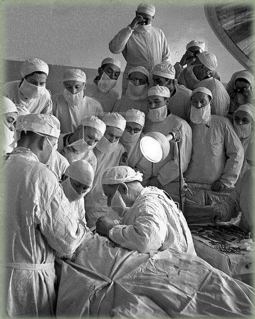
Н.Н. Бурденко оперирует

Николай Нилович не только одним из первых в мире ввел в клиническую практику хирургию центральной и периферической нервной системы, исследовал природу и методы лечения шока. Начал глубокое изучение послеоперационного периода при нейрохирургических вмешательствах, занимался вопросами мозгового ликво- и кровообращения.