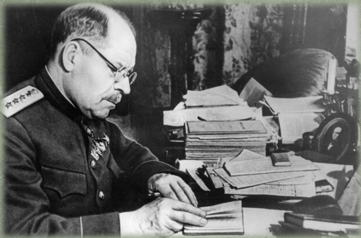
Н.Н. Бурденко в кабинете

В 1945 г. снова инсульт. Увы, операционный стол более недоступен, но остается стол письменный. Он продолжает работать. Николай Нилович занимается систематизацией полученного в годы войны опыта. Он – один из инициаторов и организаторов издания «Опыт советской медицины в годы Великой отечественной войны» в 55 томах.