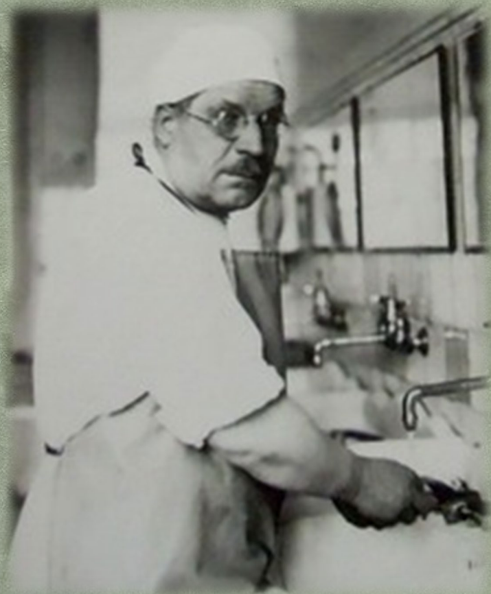
Н.Н. Бурденко готовится к операции