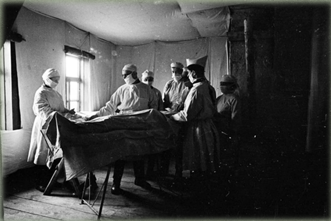
Н.Н. Бурденко в операционной полевого передвижного госпиталя

Из автобиографических записок Н.Н. Бурденко