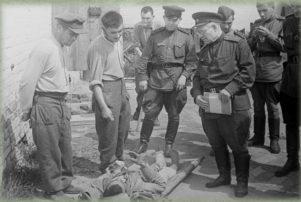
Генерал-лейтенант медицинской службы беседует с ранеными солдатами после освобождения Орла, 1943 г.

Случилось невозможное – он опять возвращается в строй и встает за хирургический стол. Кажется, это вечный человек. Что бы с ним ни случилось, он снова поднимется. Сначала оперирует в эвакогоспиталях Омска, затем возвращается в Москву и продолжает служить главным хирургом армии. Оставаясь верен себе, много бывает на фронте, корректируя работу хирургов во фронтовом районе. Затем, после перехода Красной армии в наступление, ему поручается расследование преступлений нацистов на освобожденных территориях. Это вновь не кабинетная работа – Николай Нилович выезжает на места преступлений, участвует в эксгумации захоронений и фиксирует полученные свидетельства.