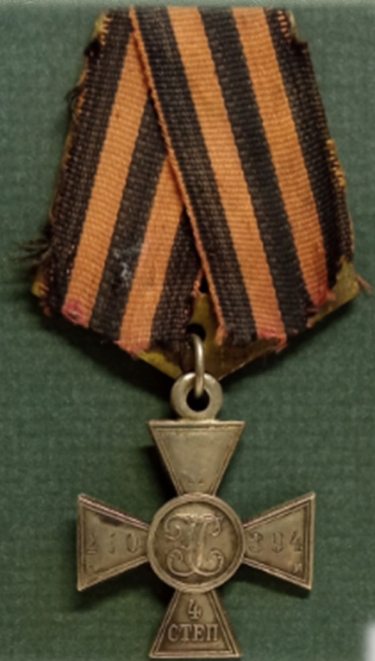
Солдатский Георгиевский крест 4 степени

Затем работал хирургом в Ржевской больнице. И, наконец, в 1906 г. успешно сдал экзамен на звание врача и получил диплом с отличием.