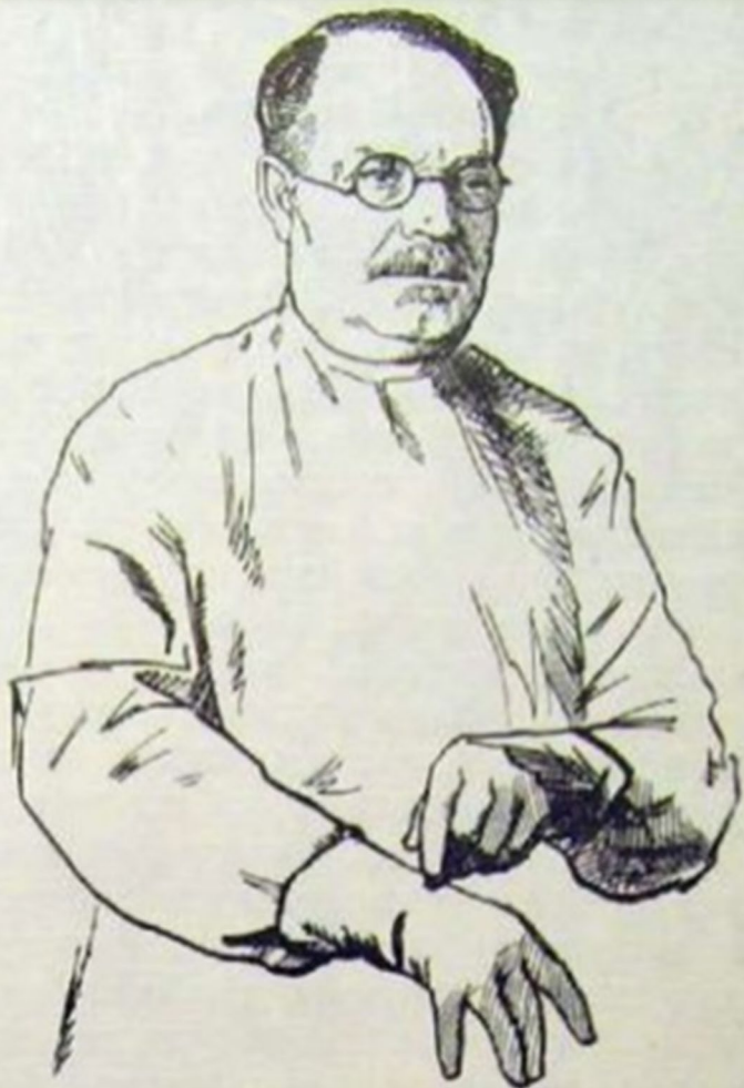
Николай Нилович Бурденко

К инициированным Бурденко нововведениям в армейской медицине относятся и расширение перечня необходимых в военной медицине специалистов: эпидемиологов, венерологов, патологоанатомов и т. д. Решать кадровые проблемы военной медицины предлагал за счет изменение программы обучения медицинских вузов, выделение активного и пассивного резервов врачей и уравнению в правах женщин – врачей. Все эти идеи Николая Ниловича мы видим воплощёнными в жизнь в годы Великой Отечественной войны.